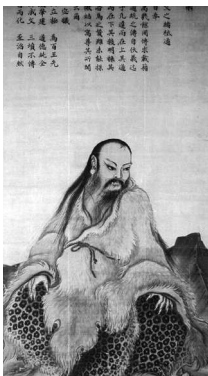
Фу Си, легендарный первый император Китая

Инь и ян — важнейшая категория древней китайской философии, отражающая двойственность этого мира. Пять элементов, возникающих в результате взаимодействия инь и ян, создают все материальное многообразие Вселенной.