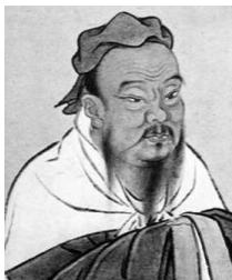
Лао-цзы, основоположник даосизма

Даосизм — древнейшее китайское философское учение, в основе которого лежит понятие «дао» — универсального закона Вселенной, управляющего природой, космосом и человеком.