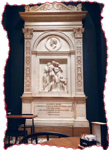
Бертель Торвальдсен. Памятник «Три грации» с посвящением Андреа Аппиани в буфете пинакоteki Бре 3 ра.

Старинное укрепление, для других городов — кремль, для миланцев так — замок, заботливо разделило свою коллекцию на пяток музеев. Не пытайтесь объять необъятное! Даже в Музее современного искусства притаились Канова и Строцци. Хоть одна работа Тьеполо висит в каждом частном палаццо, и его со временем откроют для публики. Здесь размах во всем. Сейф старинного банка так велик, что сейчас в нем проводят выставки. Шляпу великана спустили на воду кораблем. С трепетом лилипута я стоял перед