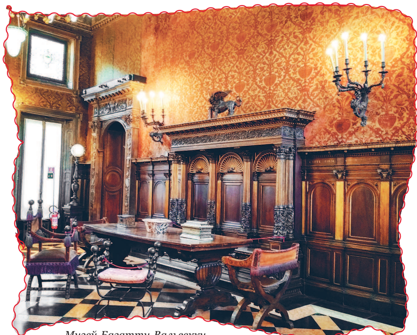
Музей Багатти Вальсекки.

Дедушка тут, дедушка там. Дивин уже разобрался, что в семье так называли Витторио Спада, деда мужа Изиль Спада. Как же это звучит по-итальянски — poppo 7 или veschio 8 ? Должно быть, poppo , veschio бывают мосты и ворота. Итальянский Петра ограничивался несколькими кулинарными и искусствоведческими терминами. Изиль