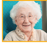
奶奶 nǎinai бабушка