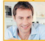
弟弟 dìdì брат