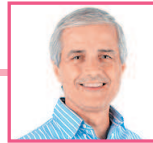
丈夫 zhàngfu муж