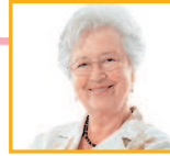
姑母 gūmǔ тётя