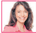
堂妹 tángmèi двоюродная сестра