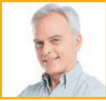
父亲 fùqin отец