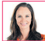
儿媳 èrxí невестка