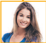
女儿 nǚ'ér дочь