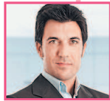
堂弟 tángdì двоюродный брат