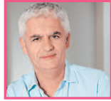
姑父 gūfù дядя