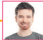
女婿 nǚxū зять