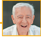
爷爷 yéye дедушка