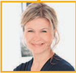
妹妹 mèimei сестра