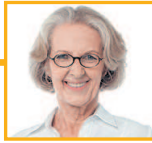
母亲 mǔqin мать