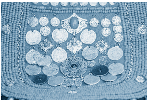
Украшенный шейный платок, деталь национального костюма тюркоязычных народов

владычества Золотой Орды башкиры приняли мусульманство, которое оказало значительное влияние на их мировоззрение, но все же не смогло уничтожить древние языческие верования.