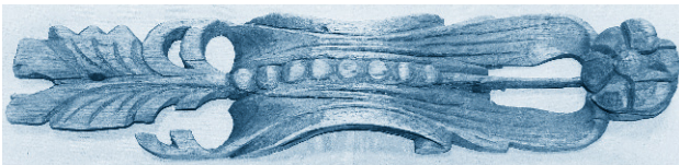
Резьба домовая. Фрагмент, кон. XIX в.