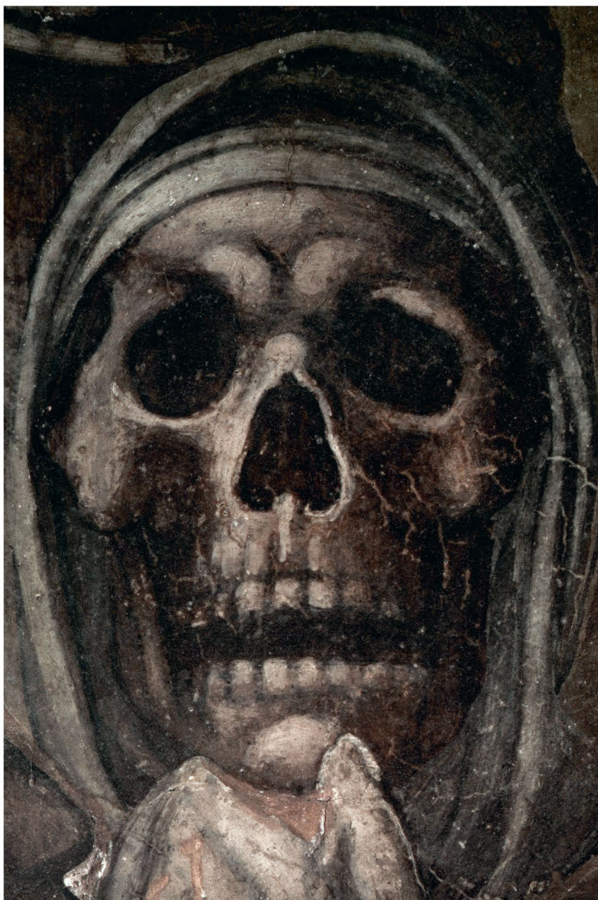
Череп. Деталь фрески «Страшный суд» в Сикстинской капелле в Ватикане. 1536–1541