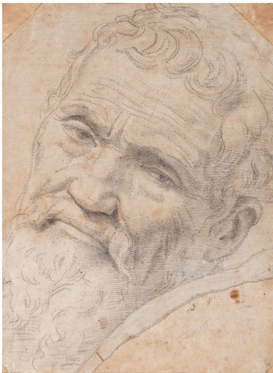
Даниэле да Вольтерра. Портрет Микеланджело. 1551–1552