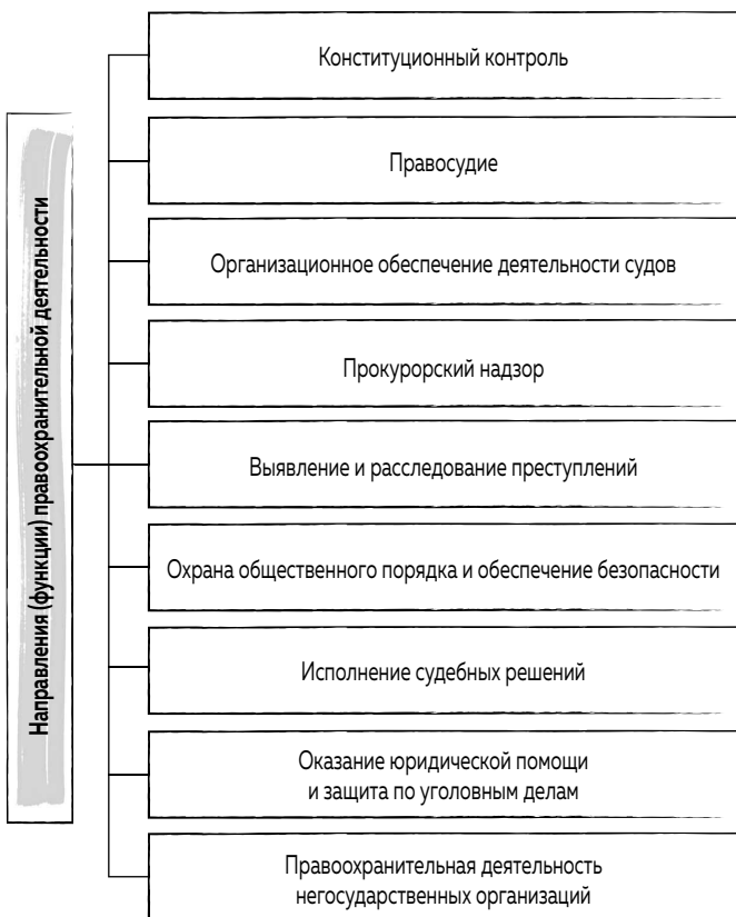
Рис. 3. Направления правоохранительной деятельности

законности и правопорядка, а также суверенитета и неприкосновенности территорий специально уполномоченными органами путем применения юридических мер воздействия в строгом соответствии с законом и при неуклонном соблюдении установленного им порядка (рис. 2).