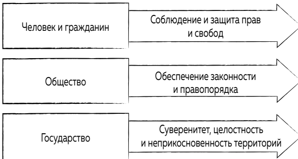
Рис. 2. Объекты и предметы защиты правоохранительной деятельности

Правоохранительная деятельность — это государственная деятельность, которая осуществляется с целью охраны прав и свобод граждан, обеспечения