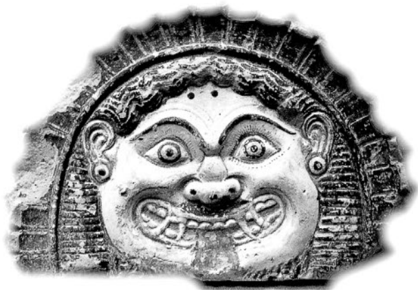
Голова Горгоны. Архитектурное украшение с острова Тасос, ок. IV в. до н. э. Государственный музей изобразительных искусств имени А. С. Пушкина

Греки обращались к богам, чтобы те объяснили им окружающий мир, ответили на вопросы: к чему гремит гром и сверкает молния, что значат землетрясения и засухи. Именно богов они благодарили за смену времен года и великолепие ночного неба. Например, они считали, что Млечный Путь, наша Галактика, появился на ночном небосводе, когда Гера отняла от груди огромного младенца Геракла. К богам люди обращались и за ответами на более простые вопросы: о переживаниях, мотивах и противоречиях, делающих нас теми, кто мы есть. Дело не было слишком трудным, поскольку боги были так же несовершенны, как и те, кем они управляли. Они тоже