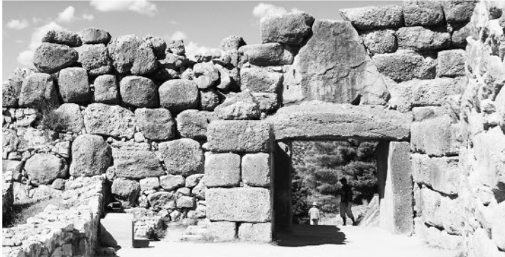
Работа гигантов: циклопическая кладка в Микенах

лопов и сторуких великанов. Вот они-то и выстроили стену из огромных камней.