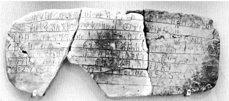
Табличка с линейным письмом, обгоревшая (и благодаря этому сохранившаяся) в пожаре, уничтожившем Пилосский дворец около 1200 г. до н. э.

Значками и идеограммами линейного письма Б чаще всего записывали сведения торгового характера, например информацию о доставке шерсти и зерна покупателям. Они свидетельствуют о беспорном таланте к организованной торговле, которая, вероятно, велась даже с Индией.