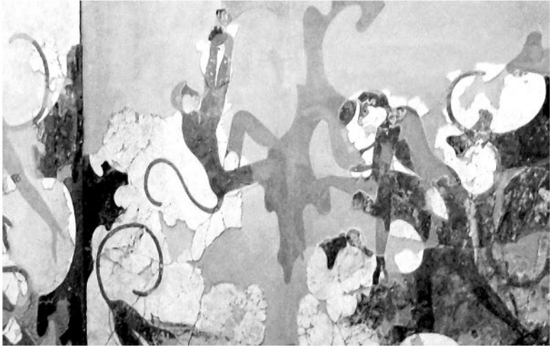
Минойские хвостатые обезьяны. Фреска из Акротири, ок. XVII в. до н. э. Музей Тиры доисторического времени

Микенская цивилизация была совершенно иной. Она зародилась около 1700 г. до н. э., когда ахейцы, кочевой народ из восточных степей, двинулись на юг и обосновались на полуострове Пелопоннес, соединенном с материковой частью Греции узкой полоской земли – Коринфским перешейком, который они называли Истм. Их общество было строго иерархическим, имело военную элиту – так называемых всадников, строило укрепленные поселения, самыми известными из которых были Микены и Тиринф. Греки, пришедшие позже, дали распространенному здесь стилю кладки название «циклопическая»: им казалось, что такие огромные камни могут двигать лишь гиганты. В какой-то момент микенцы обратили взоры к морю и вошли в контакт с минойцами, а те уже познакомили их с выгодами торговли.