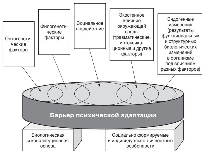
Рис. 1.2. Биопсихосоциальная модель формирования индивидуального барьера психической адаптации

Они могут компенсировать какие-либо недостатки функциональной активности соседних звеньев. В этих случаях следует учитывать влияние основных факторов, формирующих психофизическое состояние человека. К их числу относятся функциональное физическое состояние, генетическая предрасположенность, психологические (личностные) особенности, комплекс социальных факторов и др.