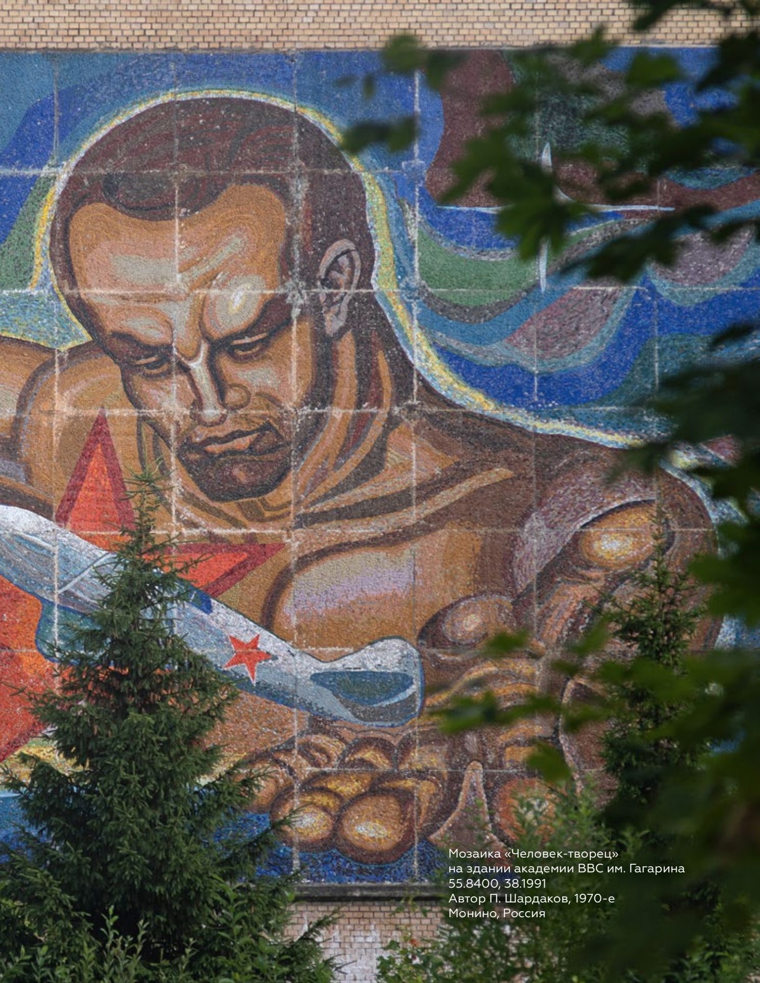
Мозаика «Человек-творец» на здании академии ВВС им. Гагарина 55.8400, 38.1991 Автор П. Шардаков, 1970-е Монино, Россия