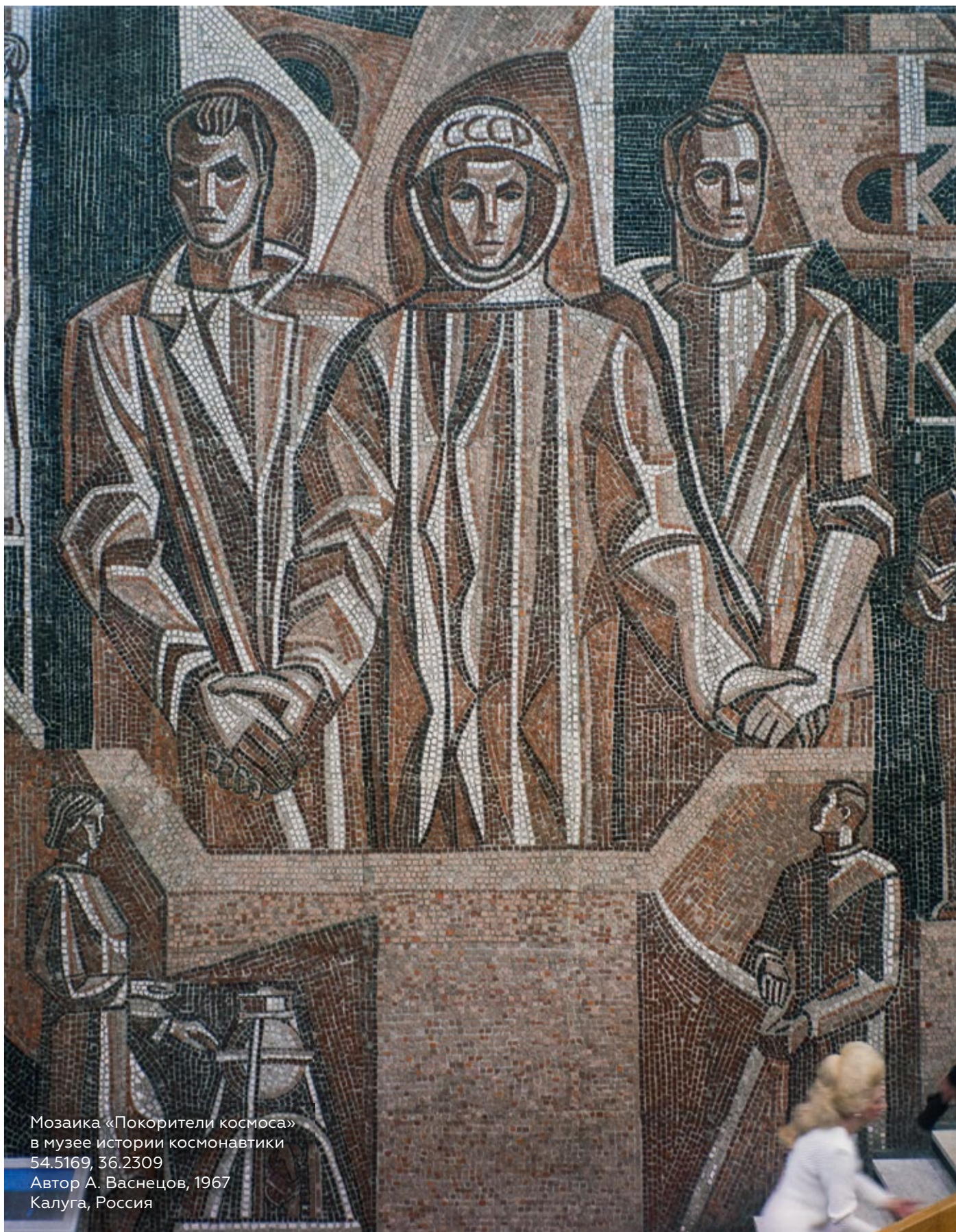
Мозаика «Покорители космоса» в музее истории космонавтики 54.5169, 36.2309 Автор А. Васнецов, 1967 Калуга, Россия