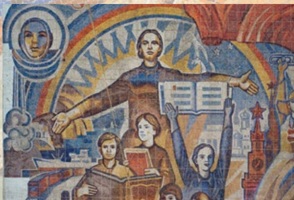
Дети: образование и воспитание 156