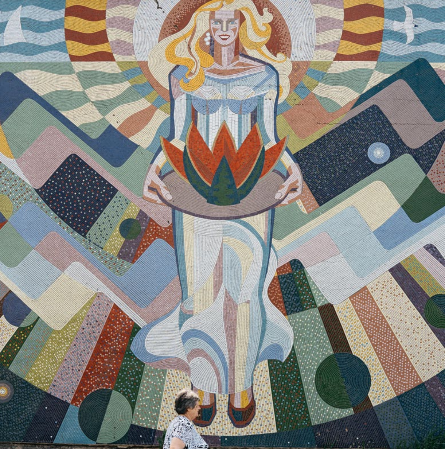
Мозаика «Девушка с арбузом» на жилом здании 50.0835, 45.4080 Автор В. Цеденова, 1988 Камышин, Россия