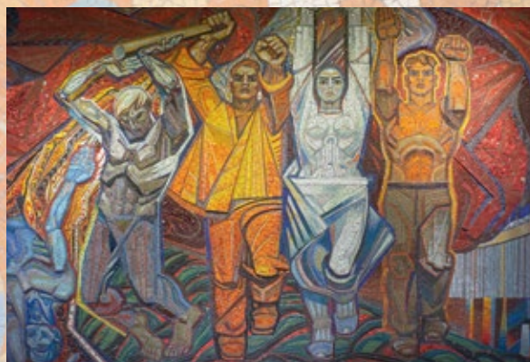
Война и мир, революция 188