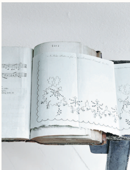
Схема вышивки для мужского галстука из приложения к журналу Lady's Magazine 1796 года.

Поместить выкройки в периодическое издание было весьма дальновидным решением. В течение нескольких лет дублинский журнал Hibernian Magazine (1771–1811 гг.) выпускал выкройки, похожие, а в некоторых случаях идентичные выкройкам Lady's Magazine . Большинство более поздних прямых конкурентов журнала, включая New Lady's Magazine (1786–1795 гг.), изысканное La Belle Assemblée (основанное в 1806 году) и великолепное Repository of Arts Рудольфа Акерманна (1809–1829 гг.), последовали его примеру. Однако ни одно из этих периодических изданий даже