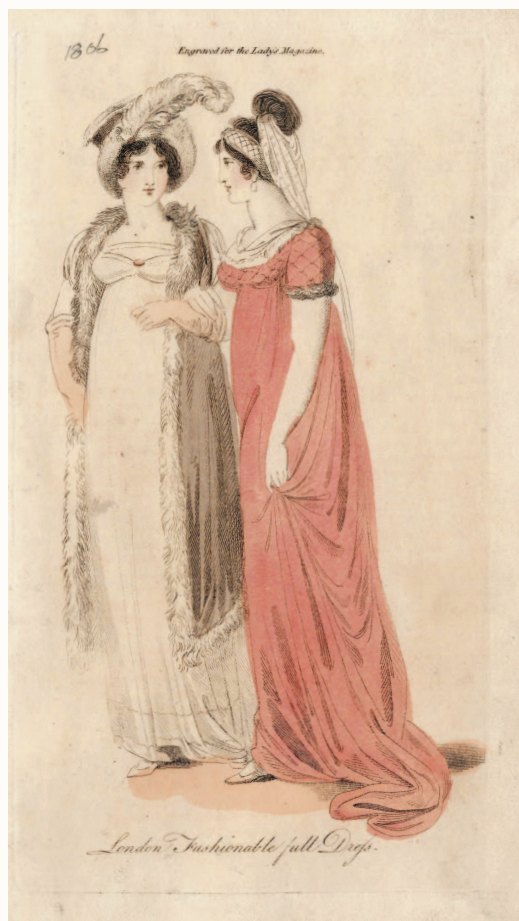
Раскрашенная вручную модная иллюстрация из февральского журнала Lady's Magazine за 1806-й год.

В основном схемы для вышивания были трех видов. Некоторые из них служили для учебных целей, — например, в 1770-х годах в журнале были