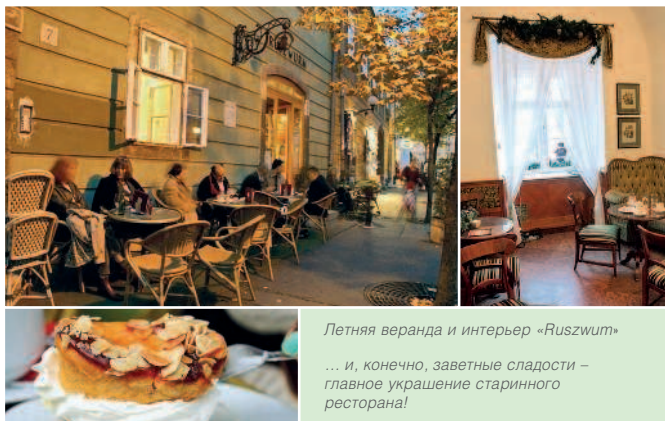
Летняя веранда и интерьер «Ruszwurm»

Вечер. Сходите на спектакль в Государственном оперном театре (▷ 46). Вечер можно провести на Liszt Ferenc tér или потанцевать в клубе Morrison's Lige.