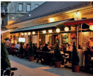
Вечерняя Ráday utca