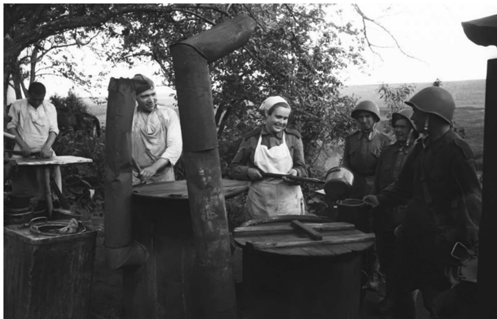
Выдача горячей пищи на советской полевой кухне. 1943 г.

Ситуация с довольствием разведподразделений изменилась 19 апреля 1943 г., когда вышел упомянутый приказ НКО № 0072. Он содержал указание установить за разведчиками питание по норме № 9, предназначенной для всех военных училищ сухопутных и воздушных сил, а также для рядового и младшего начсостава авиадесантных войск Красной Армии. Однако новая норма продержалась за разведчиками недолго. 22 июня 1943 г. вышел новый приказ НКО № 0384, отменивший нововведение: