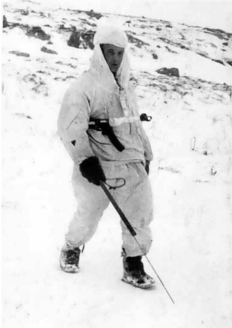
Советский сапер-разведчик из 35 гв. сп с щупом. Заполярье, 1944 г.

Если в разведку отправляется разведывательная партия силою взвод, рота с задачей вести в тылу врага бой (в целях разгрома штаба, узла связи, склада, захвата населенного пункта, моста, узла дорог и т. д.) то она обеспечивается также и групповым оружием — ручными или станковыми пулеметами, ротными минометами, ВВ, противопехотными и противотанковыми минами, противотанковыми ружьями» 1 .