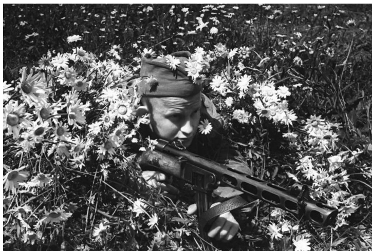
По просьбе фотокорреспондента Натальи Боды разведчик демонстрирует навыки по маскировке среди полевых ромашек. Оригинальное название фото «В разведке»

ходов на задания во вражеский тыл. Если в начале войны бойцы разведподразделений воспринимались как обычные солдаты, то по прошествии времени командование Красной Армии изменило к ним отношение. Ведь, как писал в 1944 г. один из офицеров советской войсковой разведки, «никому на войне не приходится больше разведчика преодолевать трудности и лишения, он всегда подвергается риску и опасности» 1 .