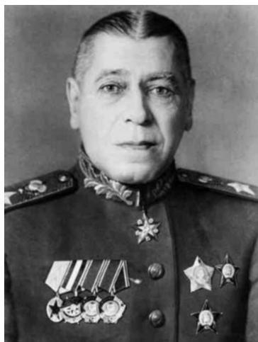
Маршал Борис Михайлович Шапошников

Чтобы понять качество подготовки разведчиков, обратимся к примерам Юго-Западного (далее — ЮЗФ. — Прим. автора. ) и Волховского (далее — ВолхФ — Прим. автора. ) фронтов конца 1942 — начала 1943 г.