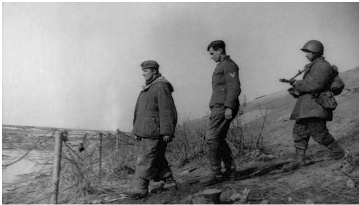
Боец Ленинградского фронта ведет двух пленных солдат вермахта. Апрель 1943 г.