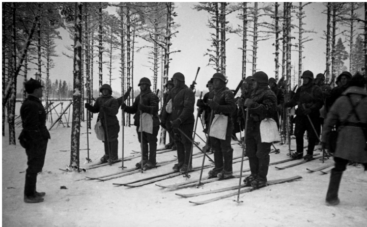
Лыжники РККА перед разведыводом. Карельский перешеек. Советско-финская война. Разведчики экипированы для лыжного похода, одеты в валенки, имеют ватное обмундирование и белые мешки на поясе неизвестного назначения

ведчика должна была быть крепкой, хорошо подогнанной и ни в коем случае не новой. Кроме всего прочего, ему полагалось брать на задание плащ-палатку и запасные носки или портянки.