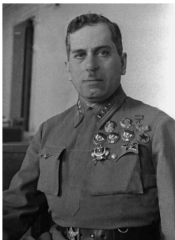
Генерал-полковник Григорий Штерн. Репрессирован и расстрелян 28 октября 1941 г. Посмертно реабилитирован

10 бронемашин, 7 мотоциклов. В штат стрелковых полков входили пеший и конный разведвзводы — 32 и 53 человека. Но гладко это выглядело только на бумаге, так как в реальности разведподразделения частей и соединений были недоукомплектованы личным составом, а имевшийся не всегда был качественным. В результате уже летом 1941 г. в Красной Армии отказались от разведбатов, заменив их разведротами.