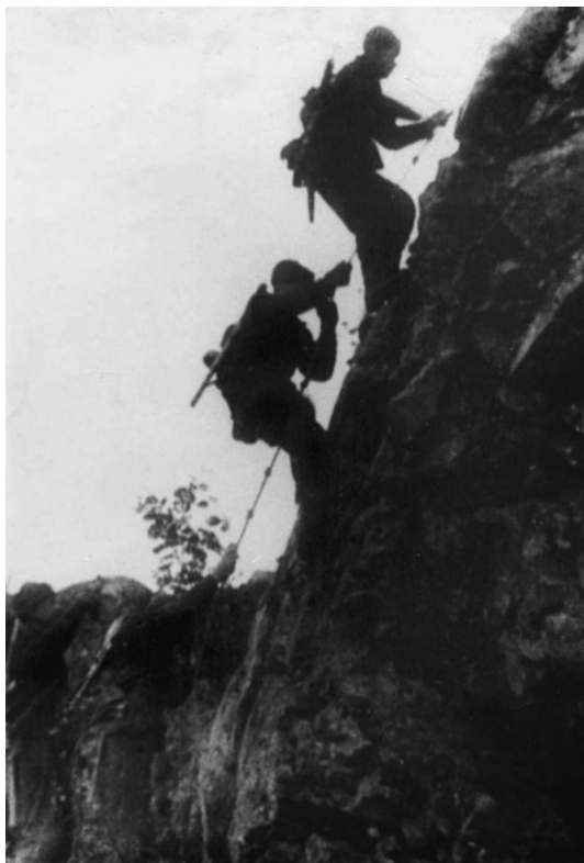
Советские разведчики на склоне хребта Муста-Тунтури. Заполярье. 1943 г.

Отдельно отметим, что, собираясь в разведку, приходилось уделять внимание разным мелочам. К примеру, разведчикам нужно было взять с собой тонкий прочный шнур, который использовался для связи внутри ядра группы в ненастную погоду. Когда видимость и слышимость ухудшались, то «сигналы передаются натяжением или ослаблением шнура, а также резким дерганием его» . Кроме того, шнур мог быть использован для связывания