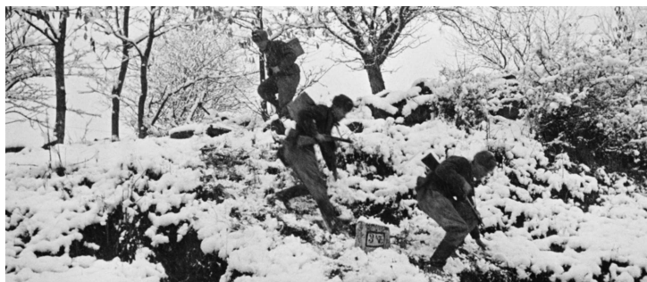
Советские разведчики спускаются по склону в Карпатах. 1944 г.

пленных. О том, что в разведке мелочей не бывает, свидетельствует уже упомянутый подполковник Поташников: