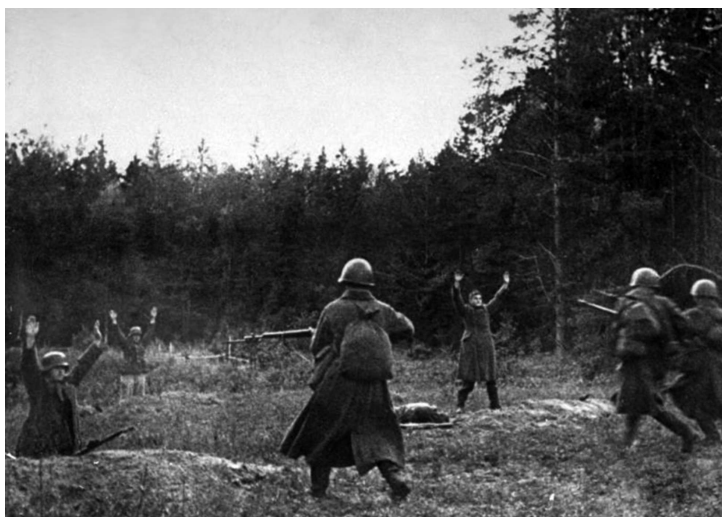
Немцы сдаются в плен советским солдатам. 1942 г.

Какую же лепту в захват пленных в начале войны внесла войсковая разведка? Увы, в 1941 г. она показала себя не лучшим образом. Конечно, так было не во всех частях и соединениях, но критических отзывов на ее действия обнаружилось больше, чем положительных. Причины крылись в недостатках подготовки разведки, а также в том, что еще в довоенное время командование не понимало ее