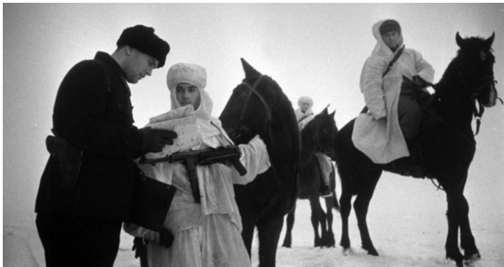
Советские конные разведчики получают задание от командира в степи под Сталинградом, Ноябрь-декабрь 1942 г.

ограничивалась дальность зрения командира части. Подбором личного состава в январе 1943-го занялся сам комполка подполковник Кузнецов, из стрелковых подразделений отобрали лучших членов кандидатов в ВКП(б), комсомольцев в число последних вошел и я.