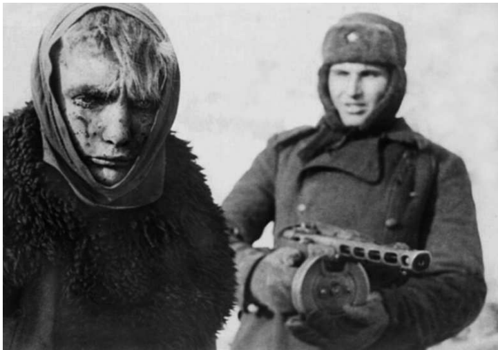
Советский солдат конвоирует немецкого пленного в Сталинграде

вызывал нарекания со стороны начальства. К примеру, 7 октября во время ночного поиска разведчики Пенькова по незнанию вышли на минное поле и подорвались на нем. Этот инцидент вызвал новые разбирательства с разведкой 426 сп со стороны командования 88 сд.