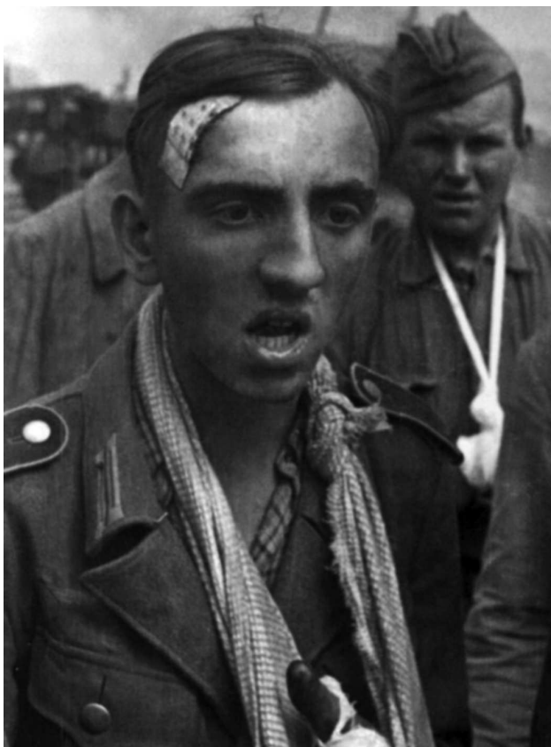
Захваченный советскими войсками раненый солдат вермахта. 1942 г. Автор А. Архипов

Анализируя причины срыва ночного поиска, Ватутин отметил три причины: