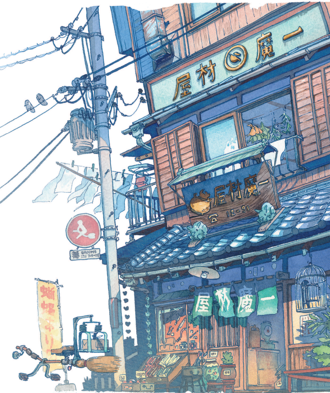
ICHI MAZAI YA (МАГАЗИН ВОЛШЕБНЫХ ИНГРЕДИЕНТОВ, РАСПОЛОЖЕН В ДЗИМБОТЁ, ТОКИО) — КАРТИНА © 2018 МАТЕУШ УРБАНОВИЧ