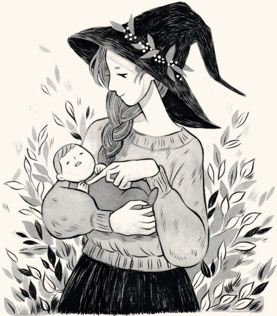
МАМА И ДОЧКА, 2016