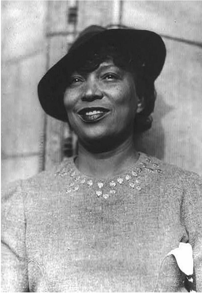
Zora Neale Hurston