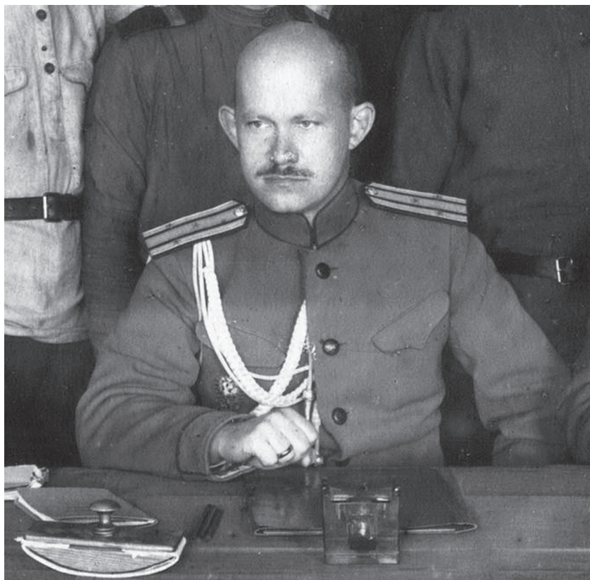
Командующий Южной армией генерал-майор П.А. Белов (Г.А. Виттекопф) в годы Первой мировой войны (на фото — в чине подполковника). Публикуется впервые.