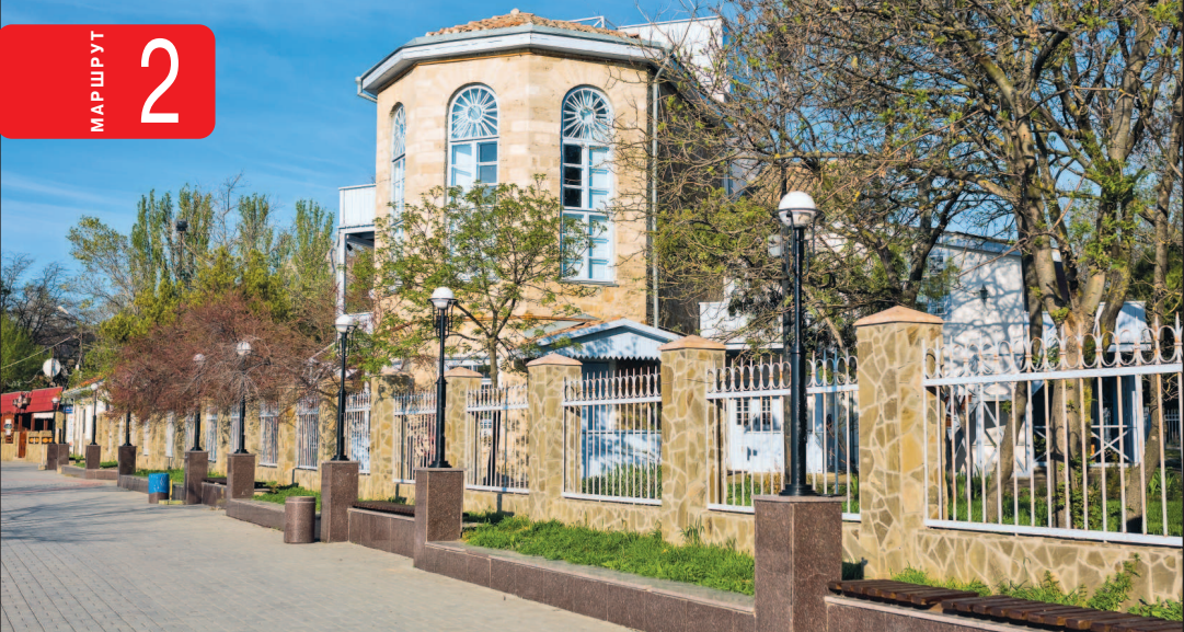
Дом-музей Максимилиана Волошина

рону огня. Пожар потух так же быстро, как и начался.