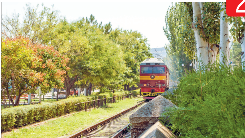
Железная дорога проходит прямо вдоль набережной

железнодорожном вокзале. С собой у них были три саквояжа и котомка с едой. Феодосия была по-весеннему хороша: город окутывал сладкий шлейф цветущей акации. Непривычно пахло солью. В этот день Грин навсегда приехал жить в Крым, в Феодосию, этот «тихий, очень дешевый, сонный городишко». Писатель поселился в доме на Галерейной, 8 (ны-