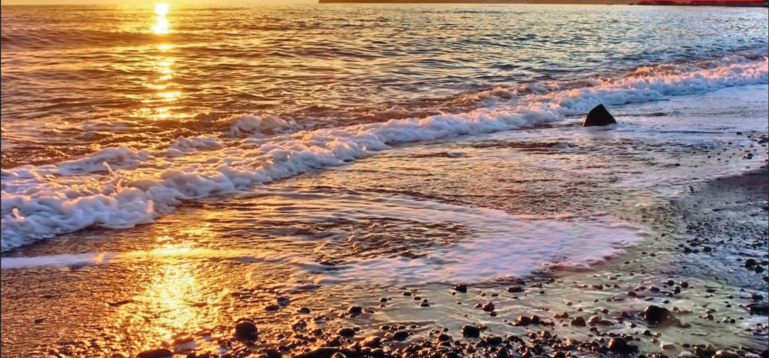
Вид на мыс Капчик в Новом Свете

Край мечтательных писателей и поэтов, вдохновенных художников, отважных мореплавателей, свободных воздухоплателей и преданных виноделов — одним словом, романтиков, которые сердцем выбрали этот особенный уголок на юго-востоке Крыма. «Киммерией» поэт Максимилиан Волошин называл участок от Судака до Керченского пролива, вдохновившись образами этой таинственной страны, воспетой Гомером.