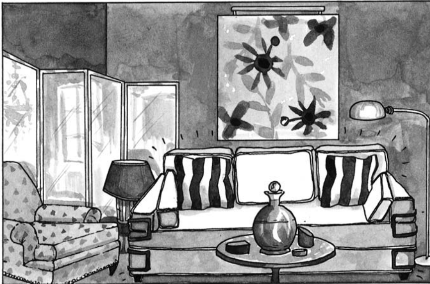
Рис. 3.3. Отличной фокусной точкой может послужить крупный предмет мебели

кресла, предметы искусства (рис. 3.3) или рояль. “Развлекательный центр” — установленный в стенке телевизор, окруженный полками с книгами — создаст прекрасную фокусную точку для общей комнаты. Если же у вас нет ни одного из этих предметов мебели, используйте несколько составленных вместе высоких этажерок. Для большего привлечения к ним внимания выньте одну или две центральные полки, сформировав искусственный просвет, в котором можно установить зеркало или картину.