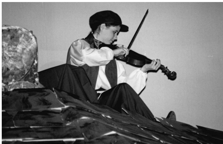
«Скрипач на крыше», 1991 г.

до Города мишуры 1 , как вообще попасть в шоу-бизнес? Я же никого не знала. Никаких связей с важными людьми. Понятия не имела, что как устроено. Я слышала, что некоторых девушек приглашали в кино прямо в торговых центрах. Значит, надо чаще ходить по магазинам? Я слышала, что в кинозвездах должна быть «изюминка», какое-то особое качество. А у меня была эта «изюминка»? Вряд ли, учитывая, что моим актерским триумфом стала роль собаки. Я слышала, что одному стендап-комику предложили главную роль в сериале. Так в чем же секрет? Может, заняться стендапом? Вообще-то, однажды я пробовала себя в стендапе. Как раз тогда я усвоила урок, что иногда лучше вообще ничего не делать. Тем не менее после колледжа я вместе со своим театральным дипломом и котом Энди села в машину — тогда у меня была Mazda 323 Hatchback — и начала долгий путь из Сент-Луиса в Лос-Анджелес.