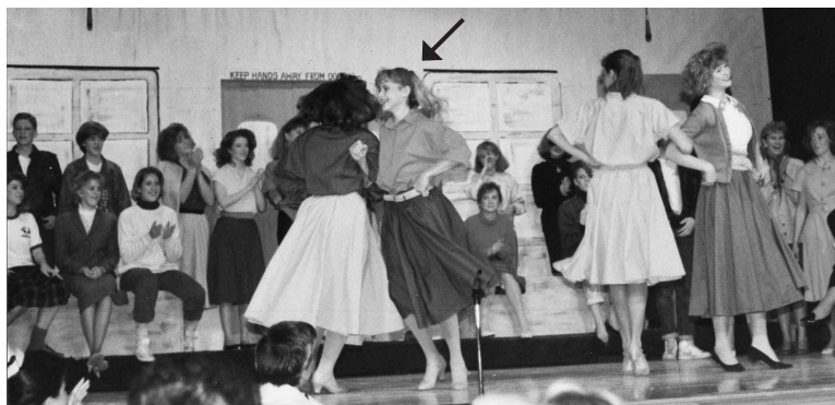
Первый год в старшей школе