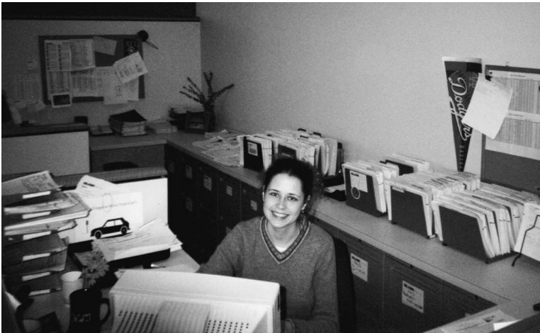
Моя фотография на одной из многочисленных работ в качестве секретаря-референта

В основном это был офис. Ирония судьбы, знаю. Благодаря обязательному обучению машинописи в старшей школе я могу печатать со скоростью восемьдесят пять слов в минуту с точностью девяносто процентов. Я подала заявку в агентство по временному трудоустройству в деловом центре Лос-Анджелеса. Работала в офисах, выполняла краткосрочные задания и получала достаточно, чтобы оплатить счета. Заработная