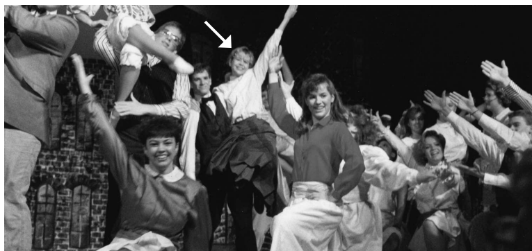
Второй год в старшей школе

Обычно мне предлагали утешительный приз: место в хоровой группе 2 . Не верите? Смотрите сами.