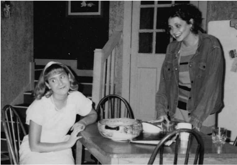
«Преступления сердца», Государственный университет Трумэна, 1995 г.

превращают вас в актера. Мы работали над голосом, движением, проработкой героя. Мы читали горы пьес, ставили кучу сцен. Выучивание реплик было привычным делом.