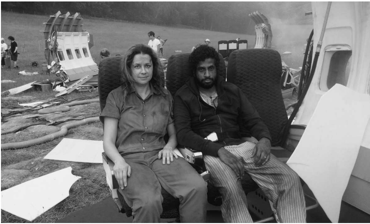
С актером Прасанной Пуванараджой на съемках сериала «Ты, я и конец света»

трюки, играть в сценах с пожарами и погонями на автомобилях или с вот такой масштабной авиакатастрофой. Ощущаю себя звездой. Мне ужасно повезло. И я благодарна, что все сложилось именно так. Приходится ущипнуть себя.