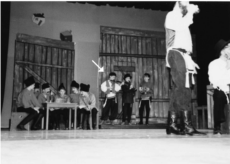
Четвертый (последний) год в старшей школе. Пиликаю что есть силы. Серьезно, можно ли оказаться еще дальше от зрителя? Вряд ли