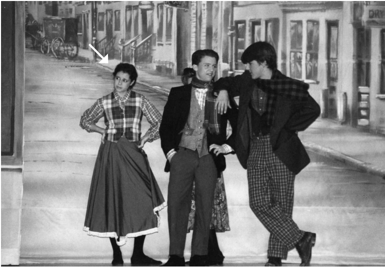
Третий год в старшей школе