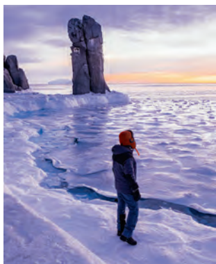
Прогулка по припаю

Есть в ее истории и трагичные страницы, мы расскажем и о них. Известна она именами своих славных дочерей и сынов, музеями и стройками, удивительными по красоте ландшафтами. Мы постараемся в этом путеводителе как можно точнее раскрыть все невиданные чудеса края, равного которому нет на всей планете. И в этом убеждаются все, кто стал его гостями хотя бы на короткое время, которого всегда не хватает истинным путешественникам с открытыми сердцами и любопытными взглядами. А сердцем величественного края предстанет перед гостями 100-тысячный, гостеприимный Магадан, светлый город между двух бухт Охотского моря,