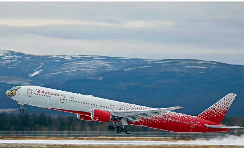
Международный аэропорт Магадан

По дороге в Магадан из Якутии придется переправляться через реку Алдан у поселка Хандыга. Паром работает с мая по октябрь, в остальное время транспорт пересекает реку по ледовой переправе. Не доезжая до города Сусумана, можно свернуть на более короткую Тенькинскую трассу (474,5 км), изобилующую крутыми перевалами. Ее официальное название «Палатка – Кулу – Нексикан». Перед поселком Палатка Колымская и Тенькинская трассы соединяются. При въезде в поселок расположен пункт таможенного контроля, обозначающий границы Особой экономической зоны Магаданской области. Обе дороги всесезонные. Но зимой температура на трассе может опускаться до -60^{\circ}\text{C} . Подробнее в маршруте 17 «Золотое кольцо Колымы».