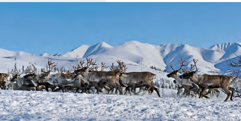
Стадо оленей, Северо-Эвенский округ