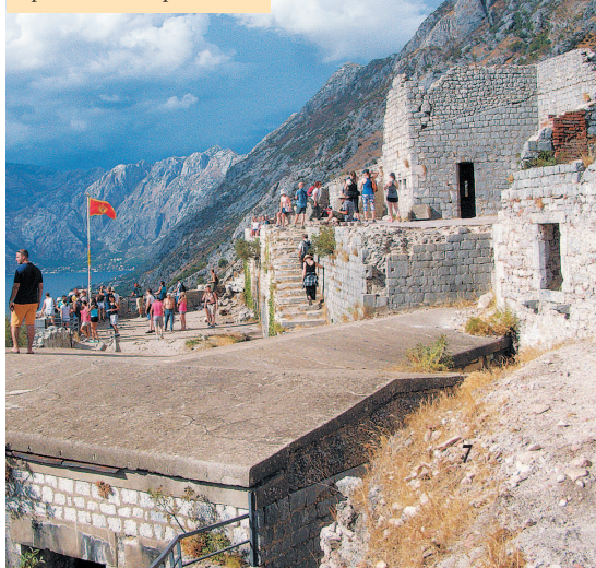
Крепость на горе Ловчен

Следует учитывать, что реальная картина будет несколько отличается от того, что выдаст сайт. Цены тоже могут колебаться в зависимости от перевозчика, времени года и еще бог весть каких причин. Потому всю информацию на эту тему следует принимать как ориентировочную.