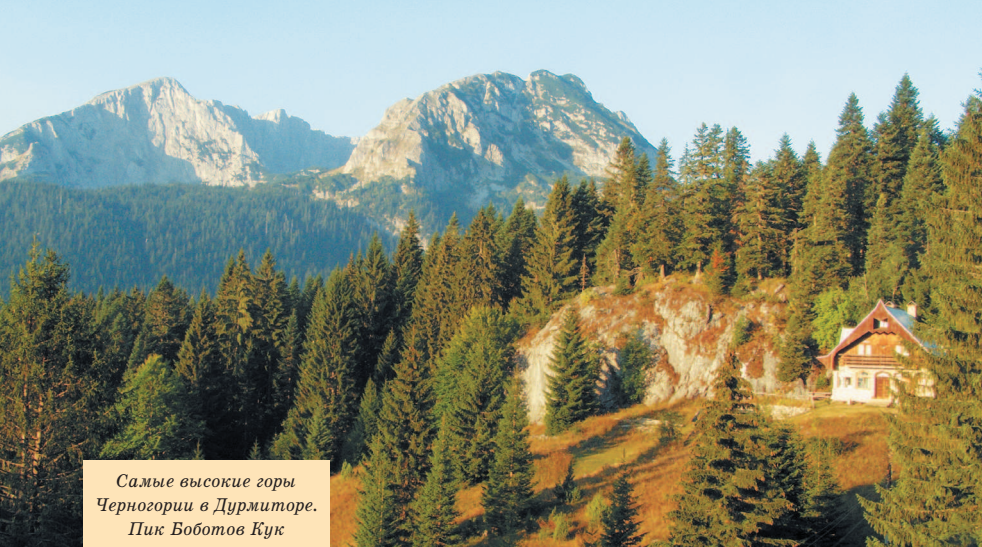
Самые высокие горы Черногории в Дурмиторе. Пик Воботов Кук