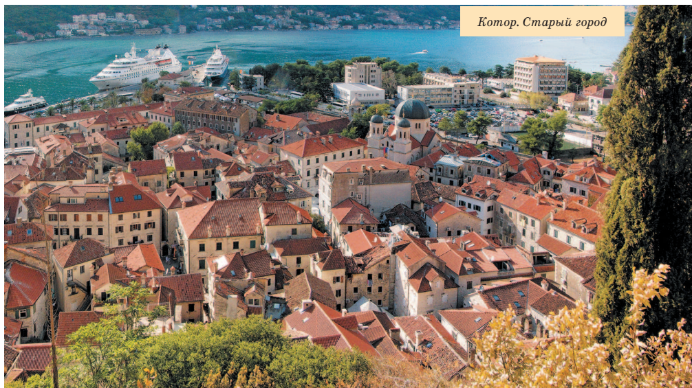
Котор. Старый город

Сказать, что Черногория – красивая страна – это не сказать ничего. Черногория – огромная картинная галерея, по которой вы будете бродить в детском восторге с открытым ртом. А картин здесь множество, самой разнообразной тематики: морские, горные и городские пейзажи, жанровые сценки, натюрморты и даже соцреализм.