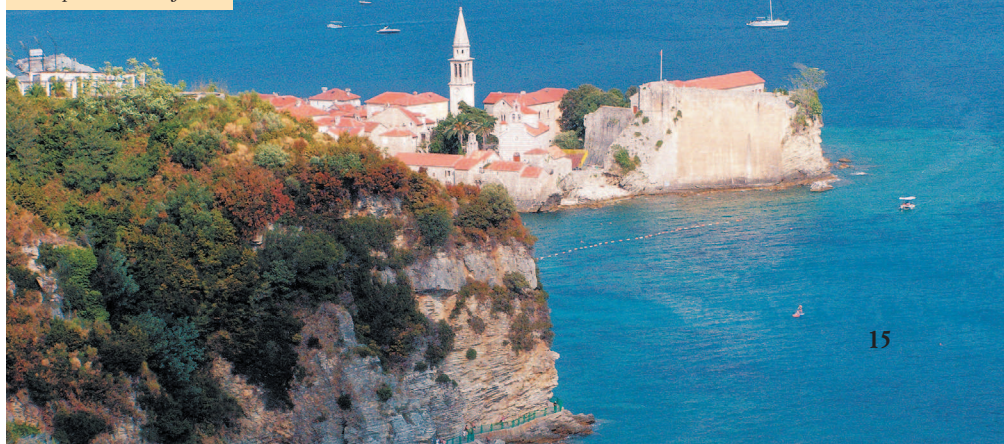
Старая часть Будвы

Адриатическое побережье, имевшее общие исторические корни с внутренними районами, с определенного момента стало идти по отдельному пути развития. Когда то оно было частью Дуклянского, а потом Зетского княжеств. Так было до тех пор, пока не наступила беспокойная эпоха турецких набегов. Примерно в это же время на политическом горизонте появилась еще одна весомая фигура – Венецианская республика. Разбогатев на морской торговле, она стремилась завладеть новыми территориями, и близлежащее балканское побережье Адриатики вызывало ее интерес. Венецианцы не стремились везде бряцать оружием, предпочитая дипломатические пути, тем более что турецкая угроза заставила прибрежные города задуматься о поиске сильного покровителя. Венеция, оставляя местным общинам право самостоятельно решать внутренние вопросы. В 20-х годах XV века почти все побережье перешло под защиту Венеции. Ее покровительство приняло племя папштровичей, обитавшее к югу от Будвы, города Которского