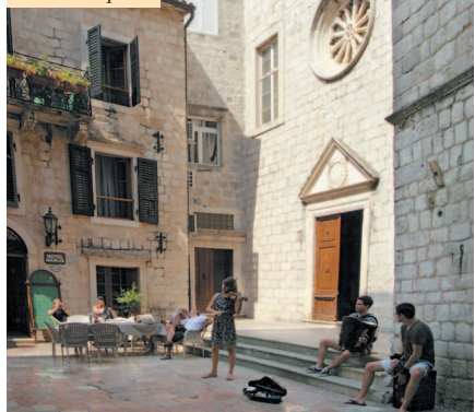
У храма Св. Осанны в Которе

Например, для женщин будет удивительно, что если у нас священники более требовательны к наличию у дам головного убора и относительно терпимы к открытым плечам, то здесь наоборот: в некоторые