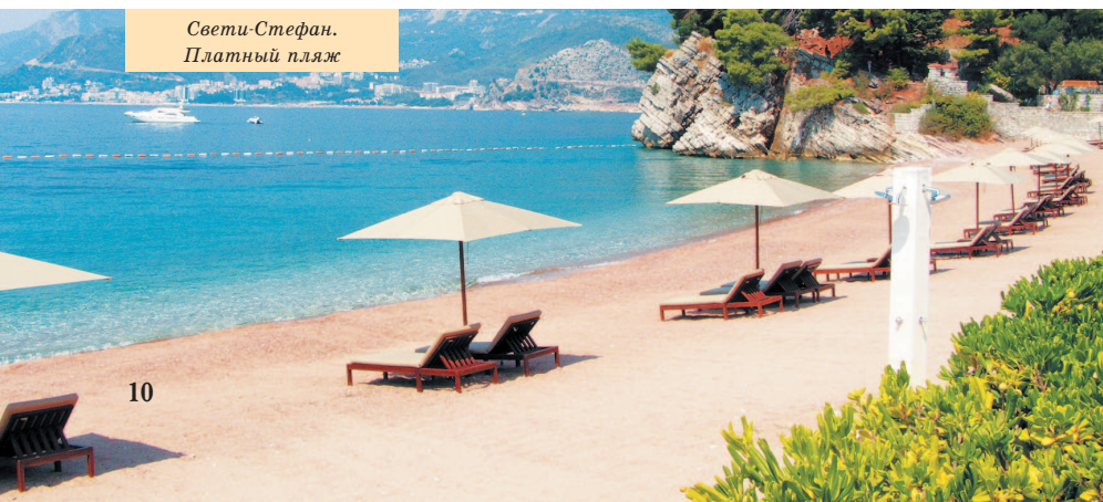
Свети-Стефан. Платный пляж

Которский залив потрясающе живописен. Ландшафты тут райские. Все, казалось бы, замечательно. Но крупных пляжей здесь нет. Кроме того, стоит обратить внимание на существенную деталь: залив, пусть даже и большой, – это частично замкнутая акватория и водообмен в нем не так интенсивен, как в открытом море. Процессы очищения идут медленнее, а берега усеяны населенными пунктами. Чтобы сделать вывод, не надо быть экологом. Но тем не менее у бокевских городков есть свои фанаты. Если вы творческая натура, любите средиземноморский колорит и неравнодушны к пейзажам, то отдых на берегах Боки для вас. А что касается воды, то на наших родных черноморских курортах ситуация куда более плачевная, так что все не так мрачно.