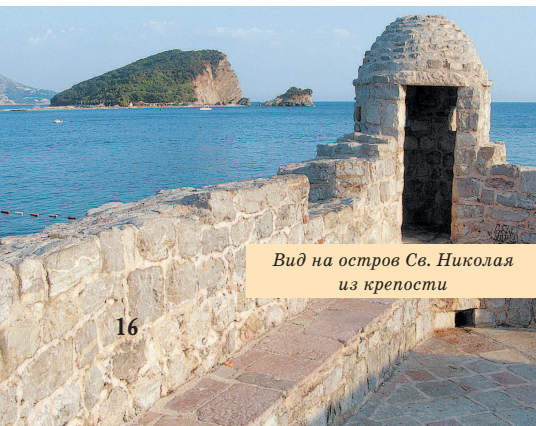
Вид на остров Св. Николая из крепости

Даже приняв в 1910 г. королевский титул, он не отгораживался от людей. Дво-