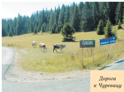
Дорога к Чуревацу

Фастфуд тоже на каждом шагу (гамбургер стоит 2,5€).