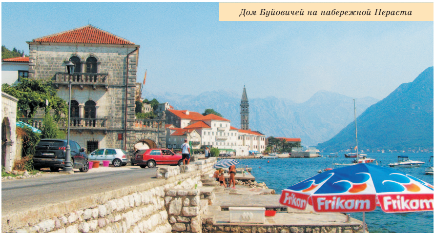
Дом Буйовичей на набережной Пераста

И так заканчивается история Зеты и начинается история Черногории. Это история