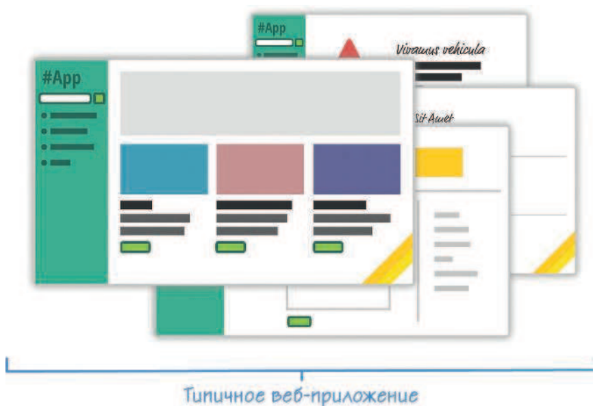
Рис. 1.1. Приложение

Если на мгновение забыть об общем улучшении внешнего вида и опыта использования веб-приложения, то в этой сфере можно заметить фундаментальное изменение. Теперь веб-приложения проектируются и создаются иначе. Чтобы убедиться в этом, рассмотрим приложение, изображенное на рис. 1.1.