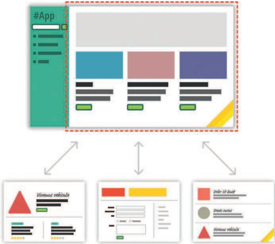
Рис. 1.4. Одностраничное приложение

В процессе взаимодействия пользователей с приложением мы заменяем содержимое области, обведенной красной пунктирной линией, данными и HTML-кодом, который соответствует тому, что пытается сделать пользователь. Это дает гораздо более плавный пользовательский опыт. Вы можете применять множество визуальных приемов для плавного перехода между элементами контента, как в тех классных приложениях, с которыми вы работаете на своем мобильном устройстве или настольном компьютере. Такие вещи невозможны, когда вы переходите со страницы на страницу.