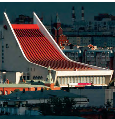
Омский государственный музыкальный театр