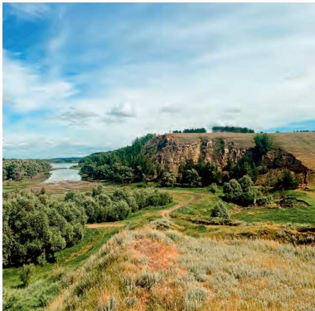
Перепады высот Горьковского района

Административный центр региона – город Омск – доступен и комфортен для посещения в любое время года.