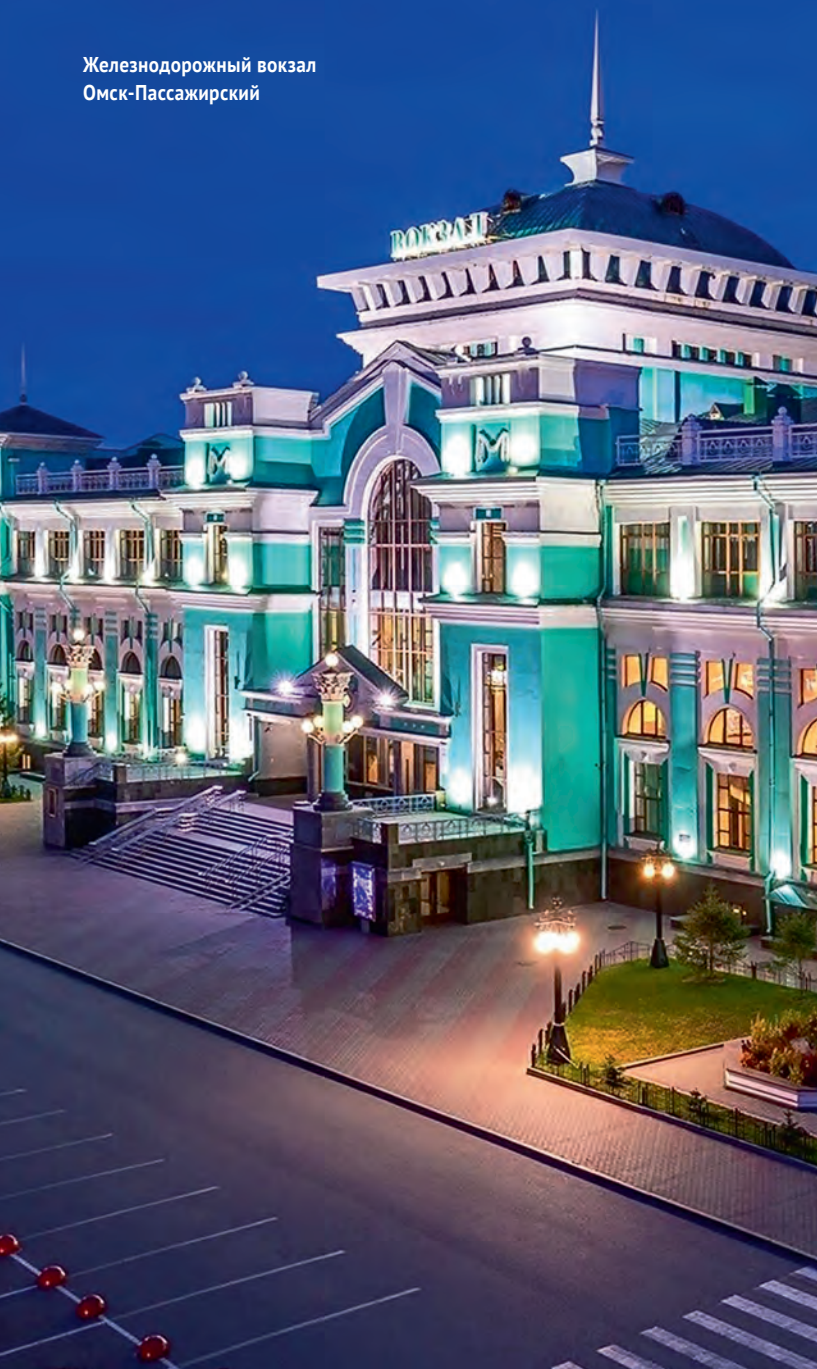
Железнодорожный вокзал Омск-Пассажирский