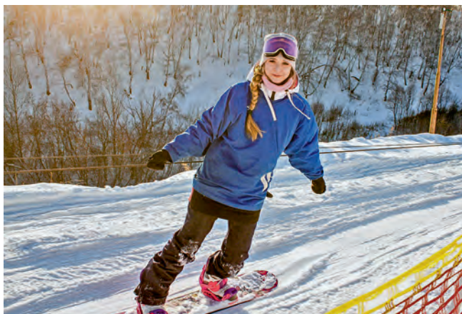
Сноупарк «Крутая горка. Адреналин»