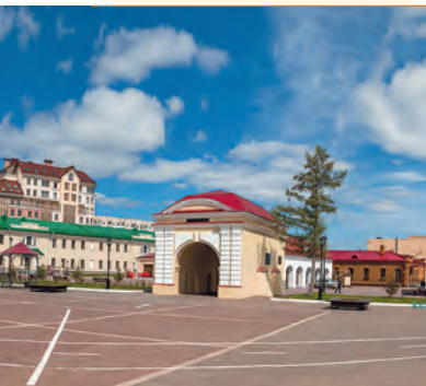
Историко-культурный комплекс «Омская крепость»

восстановлены в разное время. ! Проходя через ворота, обязательно загадайте желание!