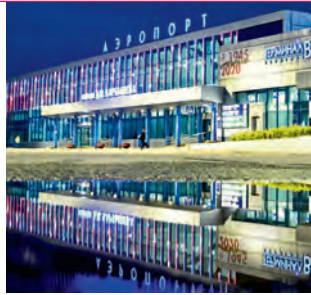
Международный аэропорт Омск Центральный им. Д.М. Карбышева

Аэропорт расположен в черте Омска, на левом берегу Иртыша (ул. Транссибирская, 28, ☎ (3812) 55-69-11). От аэропорта до центральных гостиниц можно добраться на автобусе или такси (ок. 20 мин езды). Продажа авиабилетов осуществляется с помощью онлайн-сервисов или в билетных кассах, расположенных на 1-м этаже аэровокзала.