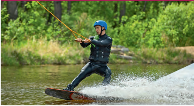
WakePark на Зеленом острове