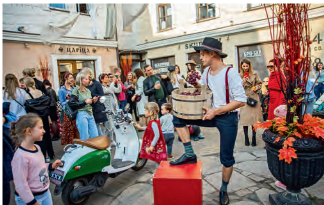
Итальянская вечеринка в Камергерском переулке