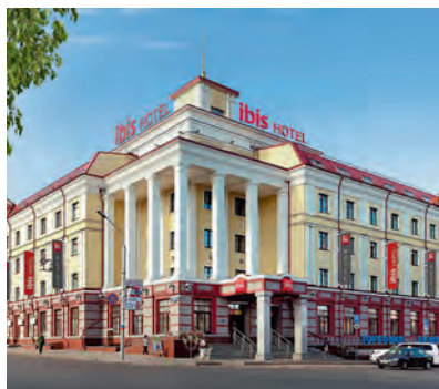
Отель «Ibis Сибирь Омск»

Находится в историческом центре Омска на площади основателя Омской крепости И.Д. Бухгольца. Из окон открывается прекрасная панорама горо-