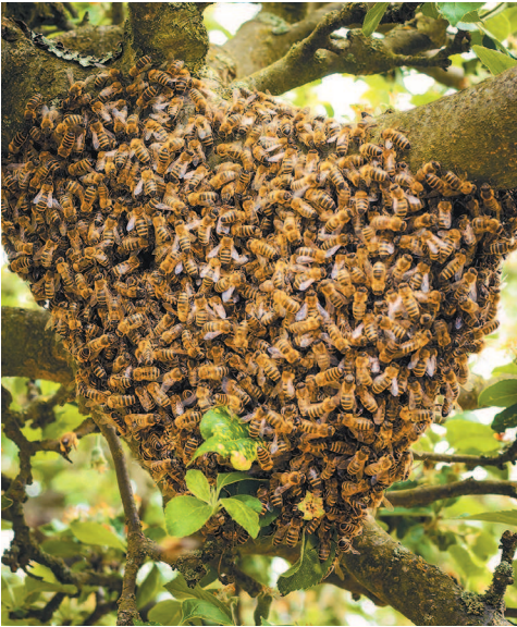
Хороший рой может весить от пяти до семи килограммов.