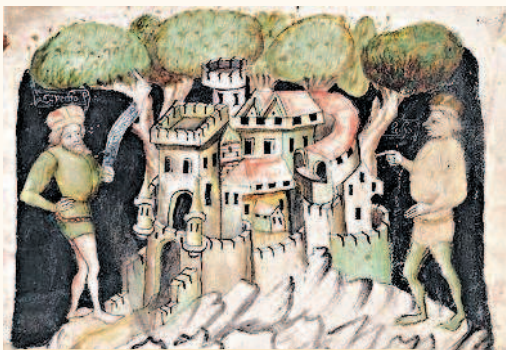
Изображение легендарных Чеха и Леха на фоне Пражского Града, вклеенное в Вудишинский список Чешской хроники в конце XIV в. Чешская хроника дала начало легенде о трех славянских братьях, впервые явив образ праотца Чеха

Легендарная Либуше, предсказав величие и мощь Праги, не ошиблась. Первыми в городе были возведены две крепости: Вышеград и Пражский Град – резиденции чешских королей. Влияние Града в начале XII в. усилилось, а его деревянные строения постепенно заменяли каменными, и