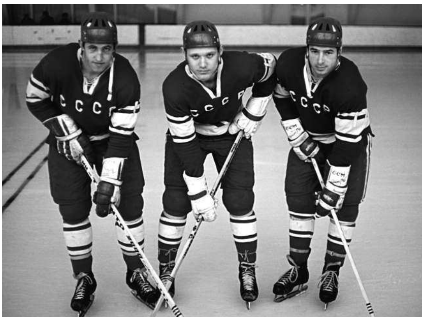
Великолепная тройка: Борис Михайлов, Владимир Петров, Валерий Харламов