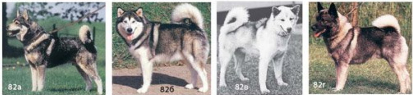
Рис. 82. Разные варианты зонарного окраса 82а — западно-сибирская лайка; 82б — аляскинский маламут 82в — эскимосская собака; 82г — норвежский эльхунд