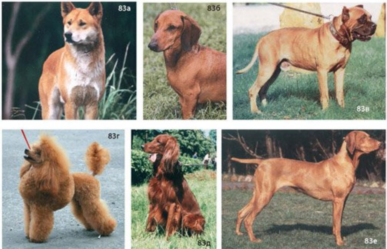
Рис. 83. Разные типы рыжего окраса Собачьи окрасы: 83а — динго; 83б — такса; 83в — алано Рыжий окрас, обусловленный аллелями e/e : 83г — пудель; 83д — ирландский сеттер; 83е — венгерская выгла