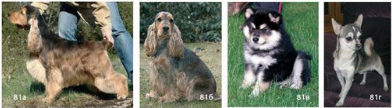
Рис. 81. Окрасы, обусловленные аллелями E^b и e^b 81а — английский кокер спаниель собачьего окраса. Генотип a^1/a^1 E^b/E^b k^p/- 81б — рисунок обратной маски на голове английского кокера спаниеля 81в — финский лахунд с окрасом, инициированным аллелем e^b 81г — чихуахуа окраса «маски», инициированного аллелем e^b