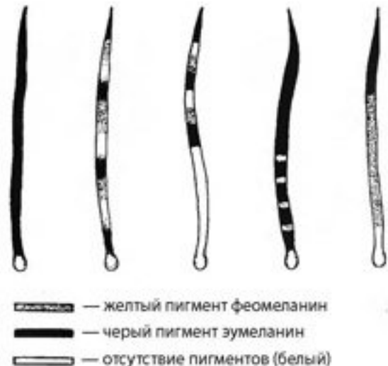
Рис. 79. Схема возможного распределения пигментов по длине волоса при зонарных окрасах