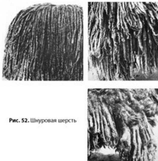
Рис. 52. Шнуровая шерсть

быть выделено несколько классов длинношерстности. Длинношерстные породы могут сохранять выраженные отличия покровных волос и подшерстка (колли, ретриверы, ньюфаундленды и т. д.) или почти не иметь подшерстка, как, например, сеттеры. У некоторых из них остевые волосы стали настолько тонкими, что практически не отличаются от подшерстка (йоркширские терьеры, афганы). Длинные волосы могут быть прямыми, волнистыми, курчавыми.