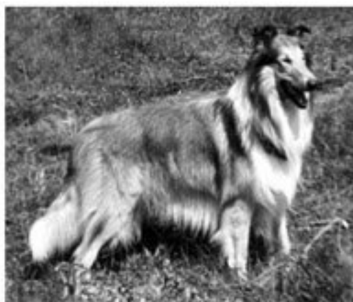
Рис. 111. Изменение облика породы, происходящее со временем. 111а — колли 1970-х годов XX столетия; 111б — современный колли

Искусственный отбор по своим последствиям для процессов индивидуального развития сильно отличается от естественного отбора. Домашние животные в большой степени вышли из-под контроля стабилизирующего отбора. Последствием этого является нарушение гармоничности работы регуляторных систем организма, обеспечивающих его индивидуальное развитие, что, в свою очередь, приводит к измене-