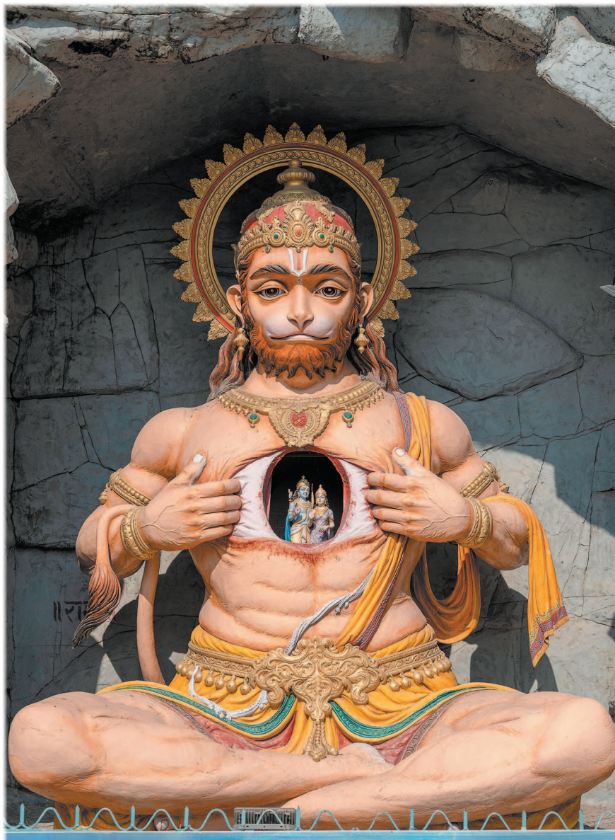
Статуя Ханумана в Ришикеше