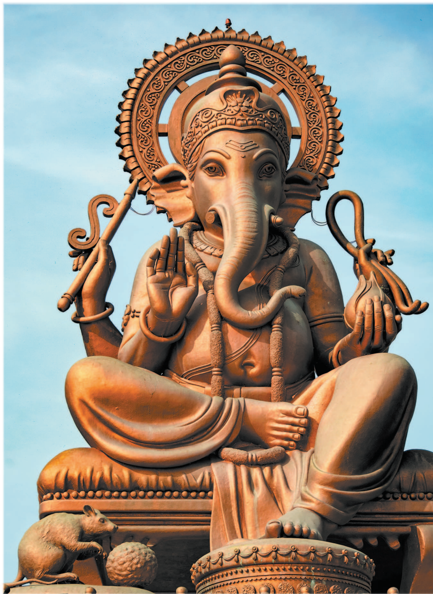
Статуя Ганеши в Пуне