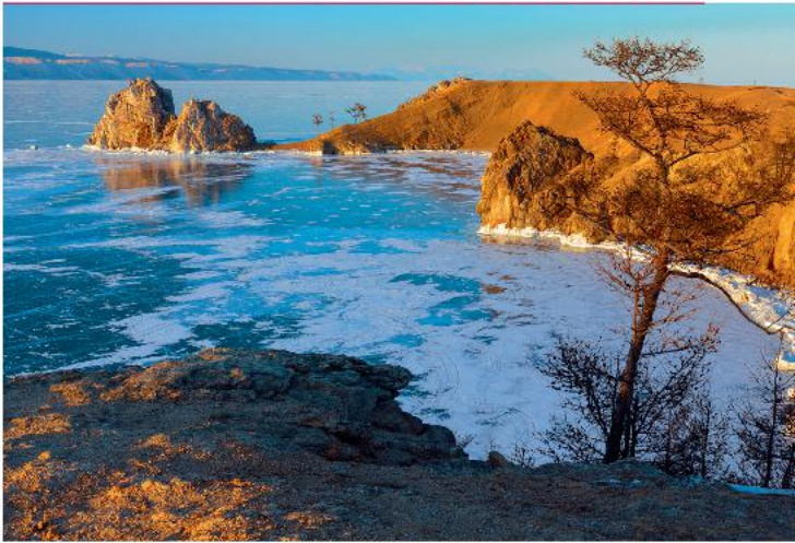
Байкал – один из символов России

празднике, посетить старинный монастырь или увидеть буддийскую святую, побывать в природном заповеднике или пройтись по старинной сибирской деревне.