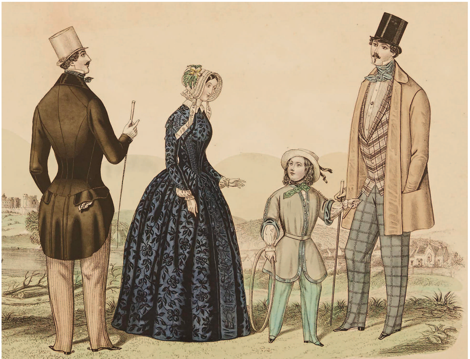
На этой иллюстрации из журнала American Fashions 1847 года представлена семья в типичной для середины XIX века одежде.

К середине XIX века Париж был бесспорным центром моды, несмотря на турбулентное состояние французской политики.