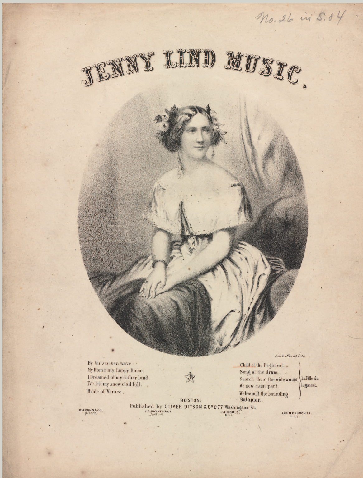
Альбом «Музыка Дженни Линд», Бостон, ок. 1850

к зрителям и «была разорвана на куски охотниками за реликвиями» 1 . Стиль Дженни Линд широко имитировали модные дамы, и некоторые историки моды даже считают ее ответственной за популяризацию трехъярусных юбок в начале 1850-х годов. Медийная вакханалия, окружавшая Линд, ее безумные фанаты и официальная сувенирная продукция были неслыханными для музыканта. Сравниться с этим мог только энтузиазм, окружавший пианиста Ференца Листа десятилетием раньше. Карьера Линд особенно важна как прототип иконографии поп-культуры, безумства фанатов и хайпа, в полной мере проявившихся в период «битломании» 1960-х годов и других похожих феноменов XX века.