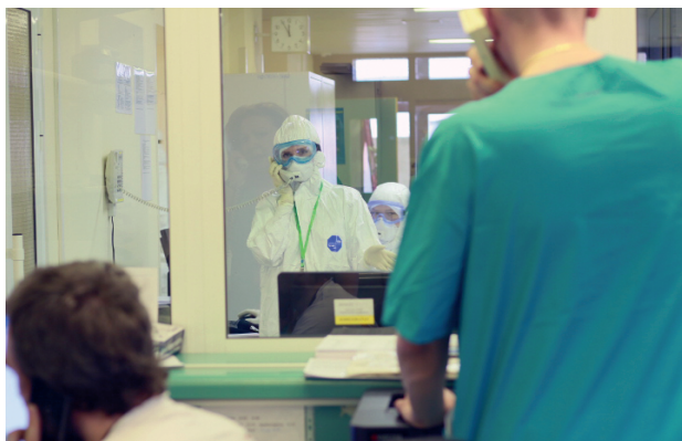
Рис. 2.3. Командная зона со стеклянной перегородкой