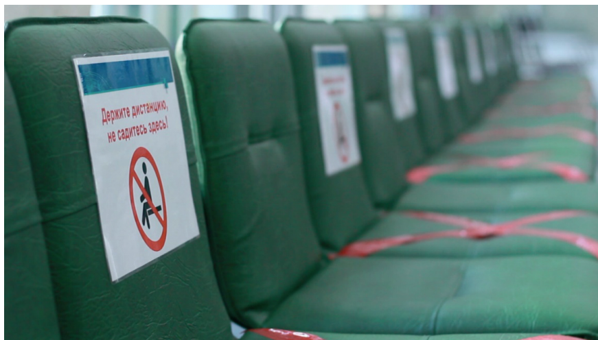
Рис. 2.4. Разметка посадочных мест для обеспечения социальной дистанции

Важным аспектом также явилась необходимость совершенствования инфраструктуры остальных зданий Института в местах массового скопления людей (центральное приемное отделение, отделение трансфузиологии и др.). В частности, был введен режим социального дистанцирования, осуществлена соответствующая разметка посадочных мест и мест в лифтах (рис. 2.4), размещены соответствующие таблички, введен запрет на посещение пациентов родственниками и др.