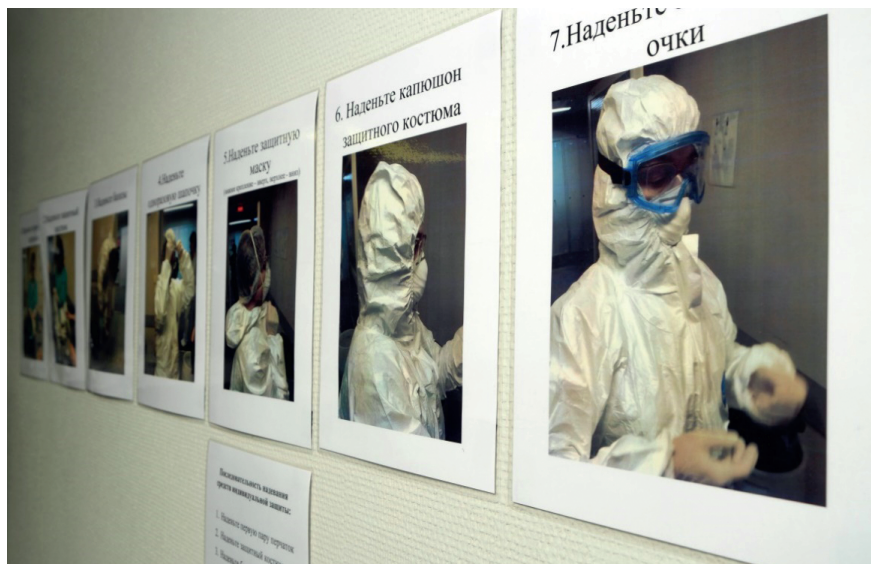
Рис. 2.5. Размещение памятки о порядке надевания средств индивидуальной защиты в санпропускнике

В инфекционных корпусах в связи с особой спецификой и интенсивностью был увеличен штат врачей и медицинских сестер на приеме, к работе в отделениях привлечены ординаторы второго года обучения на должностях врачей-стажеров, введена роль администраторов корпуса . В основном на нее были выбра-