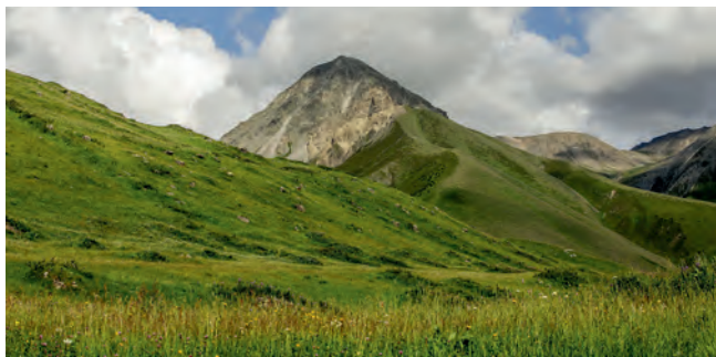
Окрестности села Ерман

Наконец, на высотах 3000–3600 м господствует высокогорный влажный климат со среднегодовыми отрицательными температурами. Граница таяния снегов находится на высоте около 3300 м.