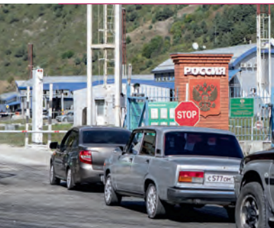
КПП «Нижний Зарамаг»

рождении с отметкой о гражданстве РФ или запись в паспорте родителя – гражданина РФ.