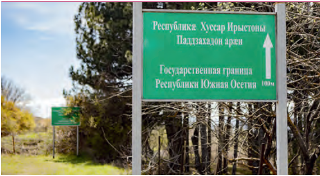
Пограничная зона Республики Южная Осетия

Реакция на пребывание в погранзоне без пропуска очень жесткая – если обнаружит пограничный наряд, то наложат штраф до 5 тыс. руб. и выдворят за пределы республики.