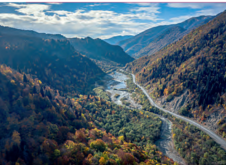
Дорога в Южную Осетию