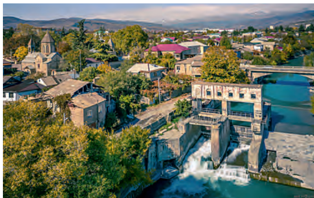
Старый город Цхинвала

Развитие города в Средние века, рост его значения потребовали возведения новых фортификационных сооружений. Из источников XVIII–XIX вв. нам известно, что территория Старого города, в частности Еврейский и Армянский кварталы, были обнесены двумя рядами стен