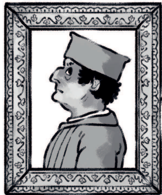
Федерико да Монтефельтро