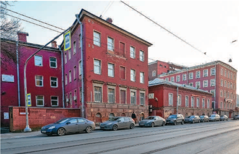
Бывшая фабрика Максвелла на проспекте Обуховской Обороны

вестно, как часто опорожнялись ямы «Максвелловских казарм», но в казармах других текстильных предприятий, например, была заведена традиция очищать их дважды в год — к крупным церковным праздникам.