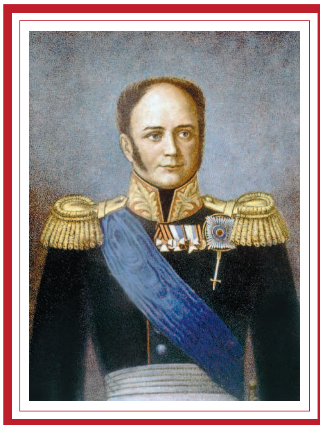
Император Александр I Благословенный (1777—1825). Почтовая открытка, выпущенная в России в начале XX века.

Их мотивом было укрепление государства путем его модернизации. Это была наиболее образованная дворянская молодежь, поддерживавшая реформы, начатые на заре правления Александра I при участии М. М. Сперанского. Они хотели стать помощниками Александра I в деле проведения реформ, которые он на их глазах так смело начал, даровав конституцию