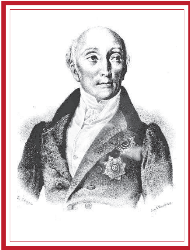
Российский государственный и общественный деятель времен Александра I и Николая I граф Михаил Михайлович Сперанский (1772—1839)

Польше в 1815 г. Отход от осуществления этих реформ их сильно разочаровал, и они стремились принудить власть к их продолжению.