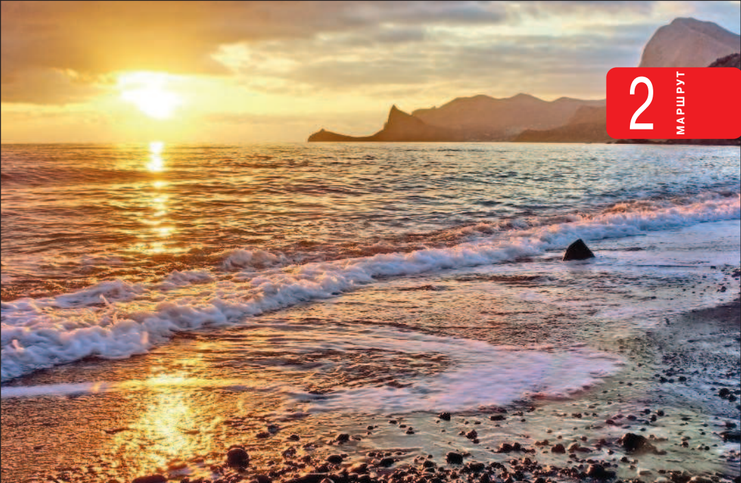
Вид на мыс Капчик в Новом Свете

Край мечтательных писателей и поэтов, вдохновенных художников, отважных мореплавателей, свободных воздухоплавателей и преданных виноделов — одним словом, романтиков, которые сердцем выбрали этот особенный уголок на юго-востоке Крыма. «Киммерией» поэт Максимилиан Волошин называл участок от Судака до Керченского пролива, вдохновившись образами этой таинственной страны, воспетой Гомером.