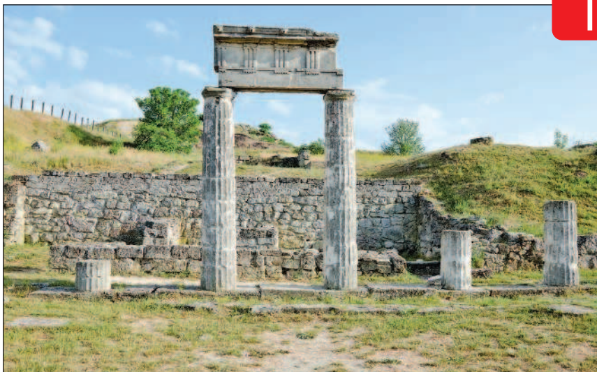
Руины древнего города Пантикапея