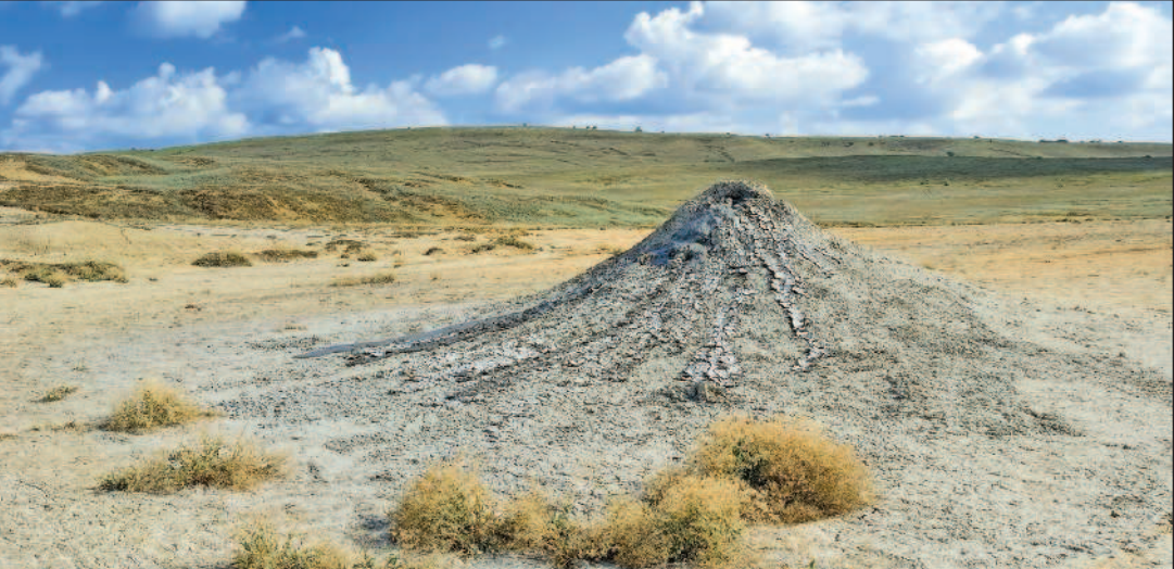
Конусообразный грязевой вулкан