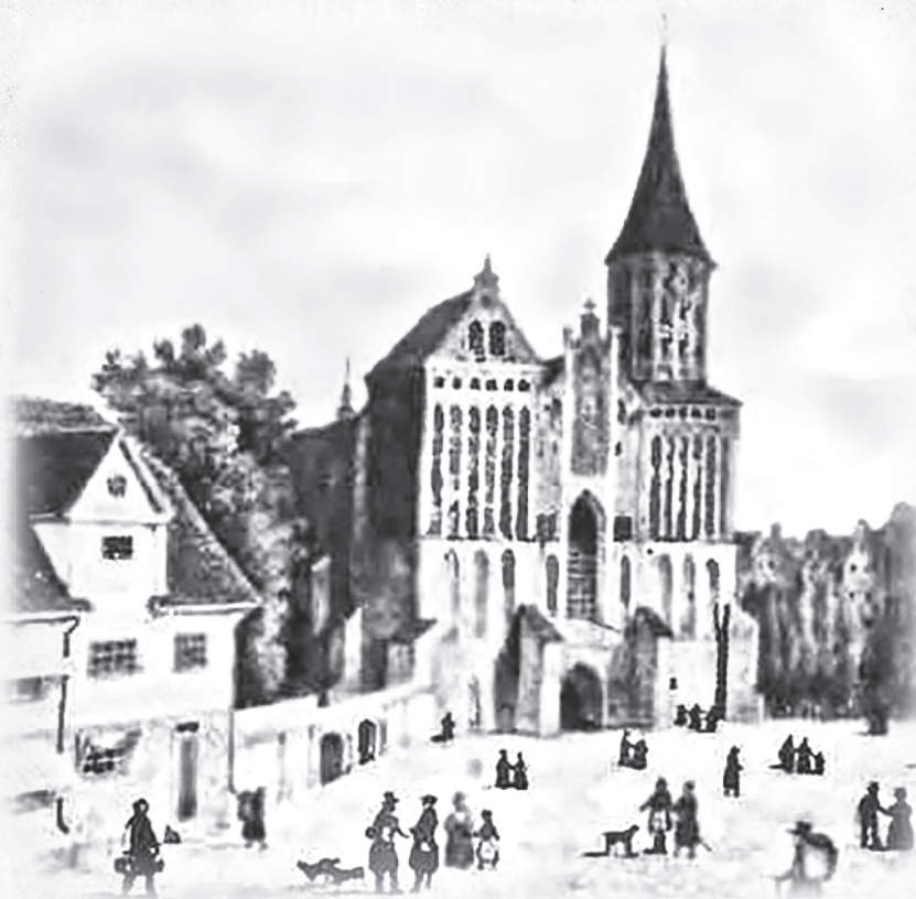
Соборная площадь в Кёнигсберге. Рисунок Гофмана