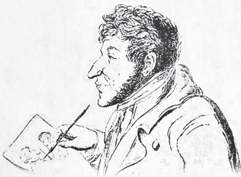
◆◆◆ Карикатура Гофмана на самого себя