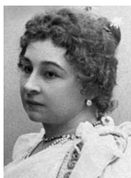
Мария Ермолова Большая звезда Малого театра