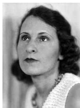
Гала Дали Муза двух гениев