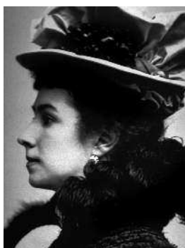
Матильда Кшесинская Прима дома Романовых