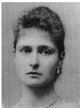
Александра Федоровна Последняя императрица