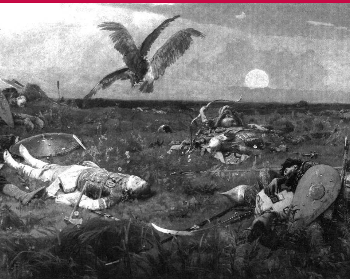
В. М. Васнецов «После побоища Игоря Святославовича с половцами» (1880)