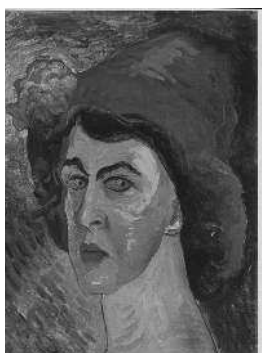
Марианна Веревкина Амазонка экспрессионизма