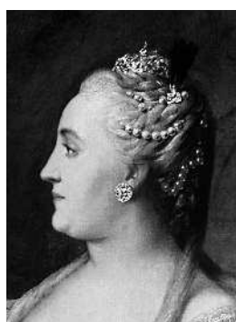
Екатерина II Императрица «золотого века»