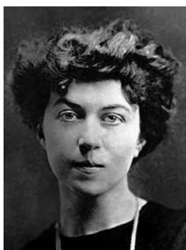
Александра Коллонтай Крылатый Эрос революции