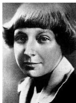
Марина Цветаева «Каждый стих — дитя любви»