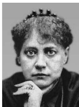
Елена Блаватская Русский Сфинкс