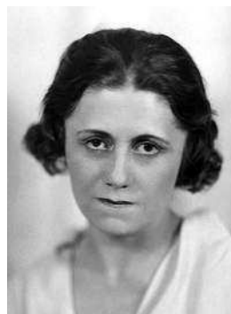
Ольга Хохлова Русская мадонна Пикассо