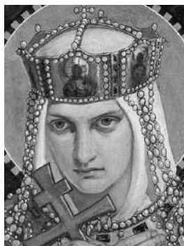
Княгиня Ольга Первая русская святая