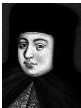
Наталья Нарышкина Мать Петра Великого