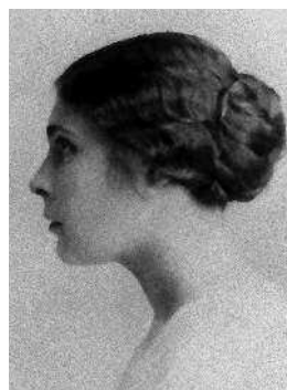
Лиля Брик Женщина- исключение