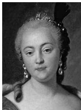
Елизавета Петровна Красавица на троне