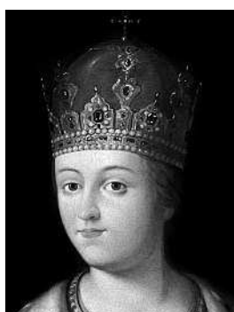
Царевна Софья Мятежная правительница Руси