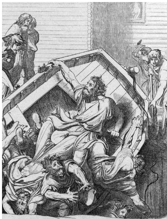
Месть Ольги древлянам за смерть мужа (гравюра Ф. А. Бруни, 1839)

Источники XIII века упоминают, что древний византийский крест находился в правой стороне алтаря храма Святой Софии, возведенного Ярославом Мудрым. Но в 1362 году, во время захвата Киева литовским князем Ольгердом, крест святой Ольги был похищен. Его дальнейшая судьба неизвестна.