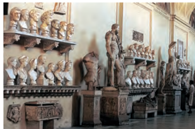
Ценное собрание античной скульптуры в музеях Ватикана

193–235 гг. Период господства династии римских императоров Северов (Триумфальная арка на Римском форуме), к которой принадлежат Септимий Север, тиран Каракалла и Гелиогабал (Элагабал). О периоде правления Гелиогабала написал французский писатель