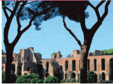
На холме Палатин строили свои виллы представители аристократии

куства, чтобы полюбоваться величественным собором Св. Петра и сокровищами музеев Ватикана. Наибольшее количество посетителей притягивает к себе непревзойденная Сикстинская капелла, всемирную славу которой принесли фрески работы Микеланджело. Потолок капеллы он украсил фресками на темы из Ветхого завета, а над алтарем часовни изобразил сцены «Страшного суда».