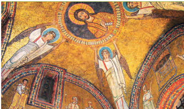
Золотая мозаика церкви Санта-Прасседе

нач. XX в. Антонен Арто «Гелиогабал, или Коронованный анархис» (1934, рус. пер. 2006).