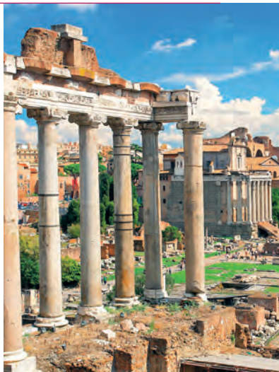
Античный Римский форум

В каком еще другом городе мира такое возможно? Спуститесь вниз с холма по лестнице Кордоната – гениальному творению Микеланджело. Прямые, спроектированные еще в Средневековье улицы выведут вас к реке Тибр, берега которого соединены с о. Тиберина двумя древнейшими мостами › с. 82. Вы будете проходить мимо здания самой большой синагоги Рима