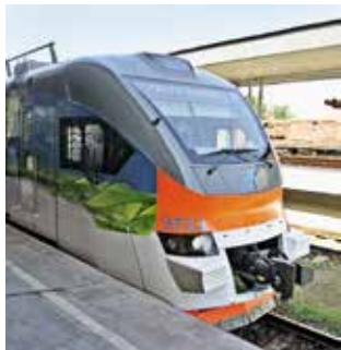
Новый электропоезд Ереван – Гюмри

Из-за транспортной блокады Армении со стороны Турции и Азербайджана железнодорожное сообщение есть только с Грузией. С Центрального железнодорожного вокзала (Ереван, пл. Давида Сасунского, 1; ☎ (+374 10) 57 50 02, (+374) 184) несколько раз в день (летом чаще) ходят электрички до Гюмри, Арарата, Аракса. Летом организуется дополнительный рейс до побережья Севана. Раз в 2 дня ходят поезда до Тбилиси, летом ежедневно курсируют поезда до Батуми.