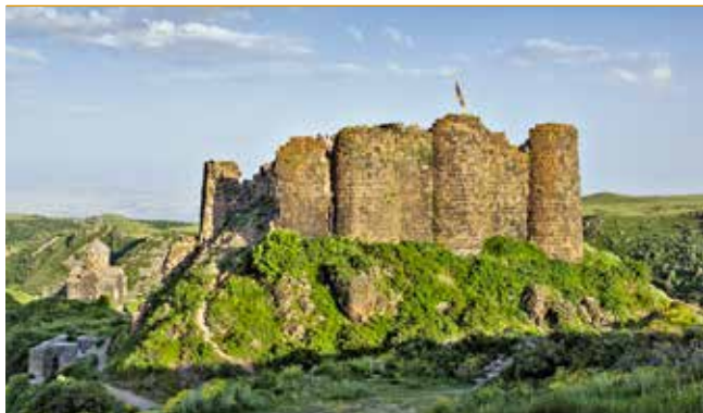
Реконструкция стен крепости Бжни

ное стратегическое значение. В XI–XII вв. эти земли принадлежали князьям Пахлавуни, которые выстроили на вершине холма посреди села мощную крепость, считавшуюся неприступной благодаря прокопанным подземным ходам в окрестные деревни, что позволяло осажденным получать провиант. В 1066 г. в большом соборе (построен в 1031 г., хорошо сохранился) монастыря Пресвятой Богородицы в Бжни прошли выборы католикоса Армении. Крепость и все поселение были разрушены войсками Тимура в кон. XIV в. Монастырь позже восстановили, и вплоть до XX в. он продолжал оставаться важнейшим центром армянской письменности, науки и культуры.