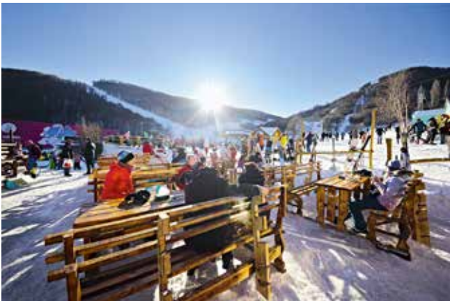
Лыжный курорт Цахкадзор

Древние города, средневековые монастыри, живописная природа, вкусная и сытная армянская кухня на основе местных экологически чистых продуктов, наконец, традиционное армянское гостеприимство – все это гарантирует туристам самые положительные впечатления от поездки в Армению и делает отдых в этой стране незабываемым.