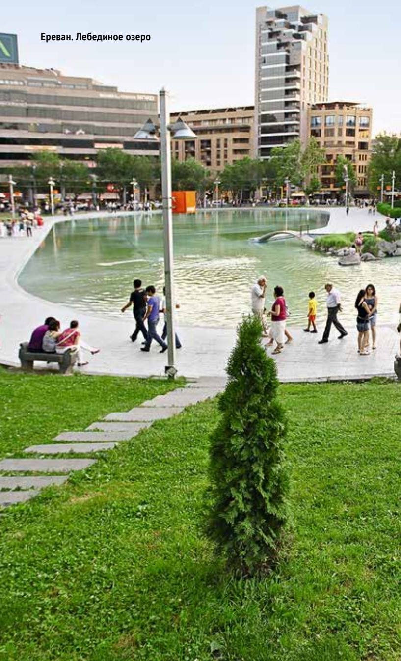
Ереван. Лебединое озеро