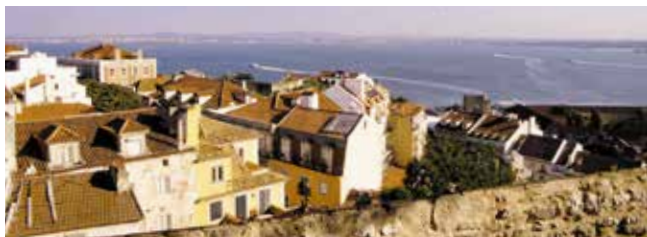
Панорамный вид на город и реку Тежу от замка Св. Георгия

День третий: Побродите по знаменитому рынку › с. 64, а затем отправляйтесь в Белен › с. 97, чтобы осмотреть монастырь иеронимитов (Жеронимуш) › с. 98. На вечер забронируйте столик в одном из ресторанчиков квартала Байрру-Алту › с. 73. Во многих исполняют знаменитую музыку фаду.