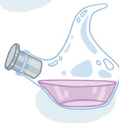
Колбы бывают разными!