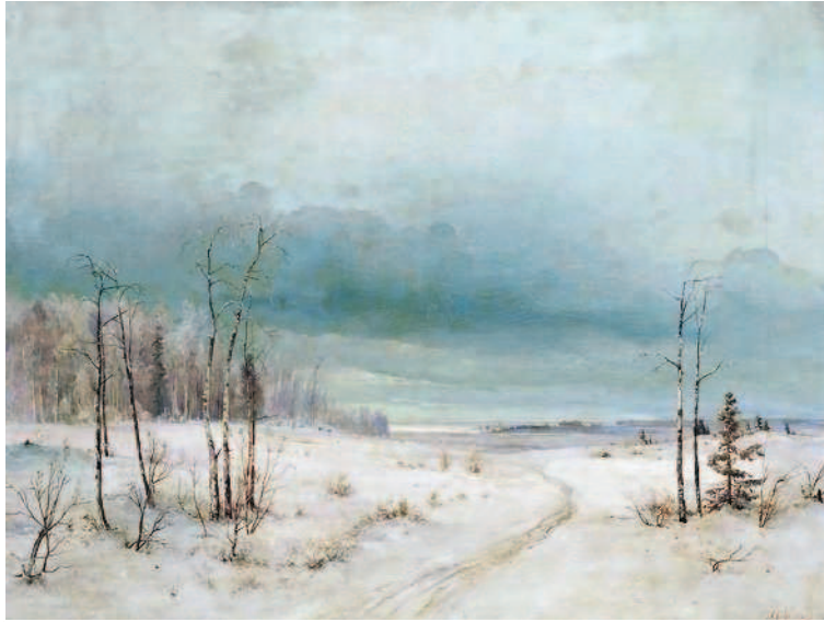
А.К. Саврасов. Зима

бо — кроет». Здесь же печаль мягко, как сама дорога, растягивается перед нашим взором. Это, конечно, связано с тем, что ударные слоги не звучат энергично и мощно. Таким образом, хорей может использоваться для выражения противоположных настроений и чувств: от ощущения силы и мощи жизни до философского размышления и грустного переживания. Именно эти лирические идеи передают диапазон пушкинской лирики 1825–1826 годов.