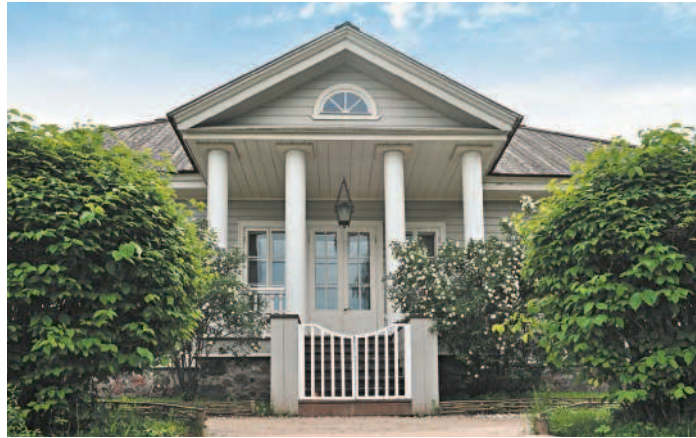
Михайловское. Музей А.С. Пушкина